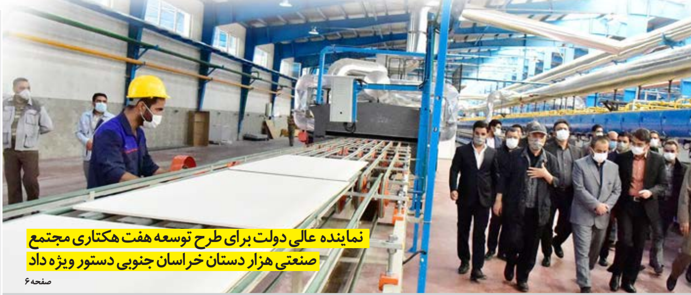
نماینده عالی دولت برای طرح توسعه هفت هکتاری مجتمع صنعتی هزار دستان خراسان جنوبی دستور ویژه داد