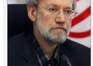
آقای فیلسوف خواهد مخاطره حضور در عرصه و هزینه احتمالی را به جان بخرد.

لاریجانی و محمدرضا باهنر و چپ سنتی مثل خوتینی‌ها و خاتمی و جریان اعتدال‌گرا، یکپارچه و هم‌نوا از شیخ دیپلمات حمایت کردند و زمینه را برای حضور او در پاستور فراهم آوردند. با این پیشینه تاریخی، لاریجانی نیز در پی هم‌صدایی مجدد همه گروه‌های سیاسی ائتلاف ۹۲ و ۹۶ پیرامون خود است. در غیر این صورت، بعید به نظر می‌رسد که