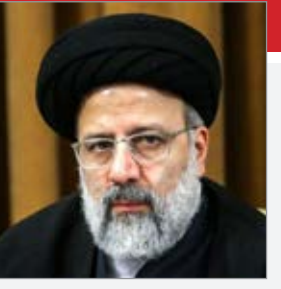
رئیس قوه قضاییه به موضوع تعطیلی برخی کارگاه‌های تولیدی پس از تملک

بانک‌ها اشاره کرد و گفت: گزارشی که از استان‌ها به ما رسیده، حاکی از آن است برخی واحدهای تولیدی که به دلیل بدهی توسط بانک‌ها تملک شده‌اند، به تعطیلی کشیده شده که این خلاف وعده مدیران عامل بانک‌ها و تأکید مقام معظم رهبری است. آیت‌الله... رئیسی به صدور رأی