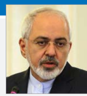
جهان‌نویز نوشت: پس از آنکه قطعه‌نامه ضدایرانی آمریکا در شورای امنیت با شکست مواجه شد، اصلاح‌طلبان و اعتدال‌گرایان در پروژه‌های هماهنگ شده به تقلا افتاده‌اند تا این موضوع را به پیروزی برجام جا زده و از این طریق به احیای چهره ظریف بپردازند و او را بهترین گزینه برای ریاست جمهوری معرفی کنند. در همین باره، صادق زیباکلام با بیان ویژگی‌های ظریف نظیر تحصیل در آمریکا، تسلط به زبان

انگلیسی، روحیه روشنفکری و ... او را کاندیدایی دانسته که اصولگرایان از کاندیداتوری‌اش برای ریاست جمهوری هراس دارند. البته که به مدیریت ظریف بر وزارت خارجه طی هفت سال گذشته انتقادات جدی وارد است و اساساً می‌توان او را نه وزیر خارجه بلکه وزیر پروژه پرخسارت برجام نامید. زیباکلام همچنین دوستی ظریف با سردار