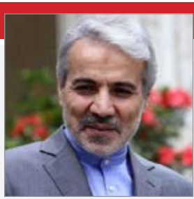
الان وضعیت خاص تحریم است و باید به اولویت‌ها توجه کنیم، ضمن اینکه هر سالی که برای تکمیل طرح‌های عمرانی عقب‌بیتیم، هزینه‌های آن بیشتر می‌شود. لذا با تکمیل آنها دارایی آیندگان، ارزش افزوده بسیاری می‌یابد.

واگذاری سهام شرکت‌های دولتی درآمد کسب شود که تا الان بخشی از آن محقق شده است. رئیس سازمان برنامه و بودجه افزود: نگرانی ایجاد بدهی برای دولت بعد هم درست نیست؛ به این معنا که اولاً این دولت و آن دولت ندارد؛