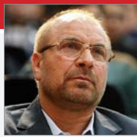
می‌شود و انقلابی در وضعیت معیشتی مردم به وجود می‌آید.

رئیس مجلس شورای اسلامی گفت: مشکلات مردم به ویژه در زمینه اقتصادی با شعار دادن بدون پشتوانه و با امید بستن به دشمنان حل نمی‌شود. محمد باقر قالیباف افزود: هر گاه حاکمان و کارگزاران مردم به دشمن اعتماد کردند، مردم متضرر شده و منافع آنان به تاراج رفت و امنیت کشور به خطر افتاد.