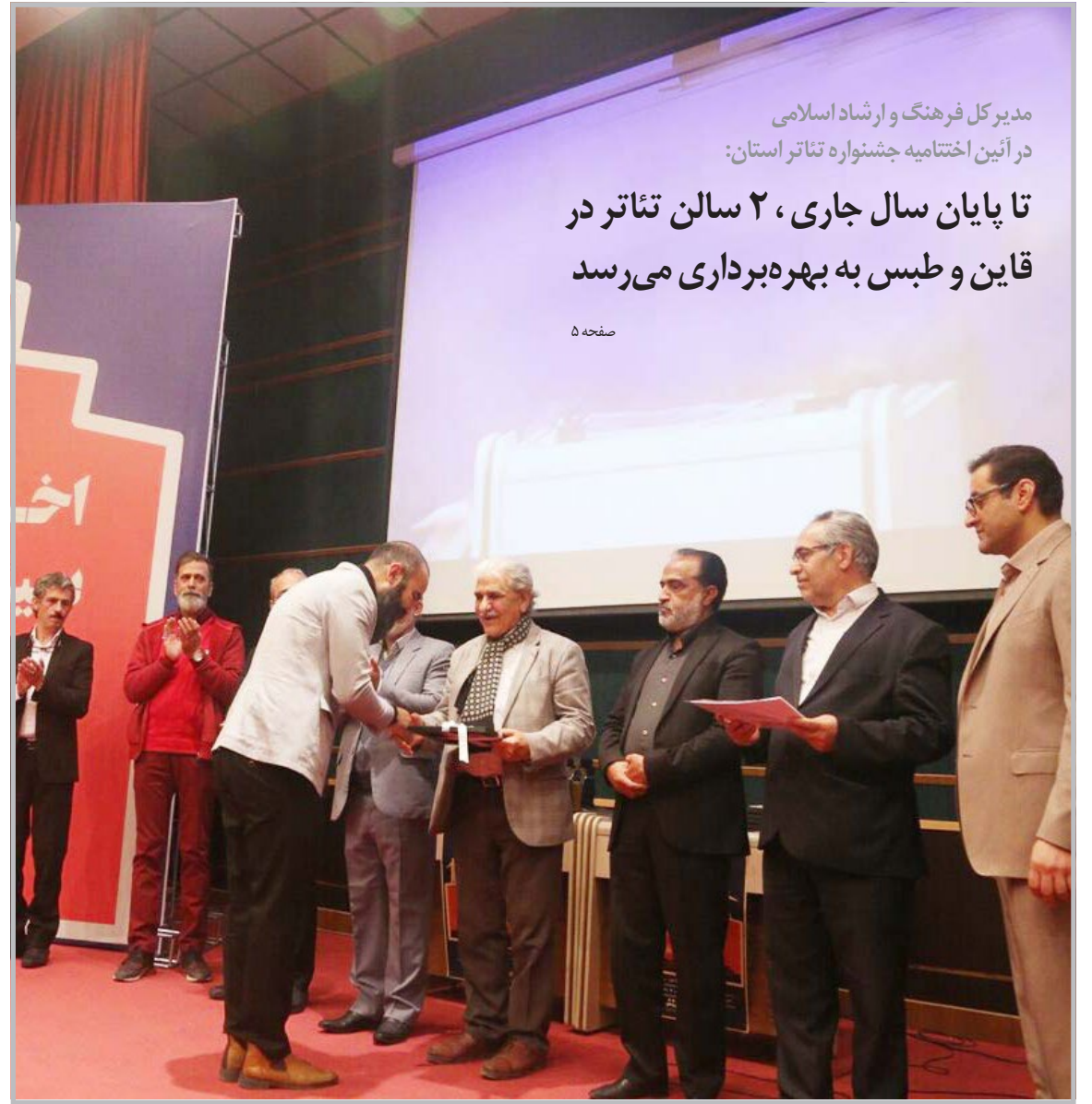
مدیر کل فرهنگ و ارشاد اسلامی در آیین اختتامیه جشنواره تئاتر استان:

تا پایان سال جاری، ۲ سالن تئاتر در قاین و طبس به بهره برداری می رسد