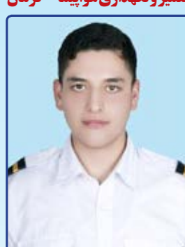
معیدسیادت تعمیر و نگهداری هواپیما - کرمان