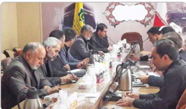
فرمانده ارتش جمهوری اسلامی ایران