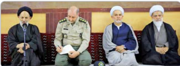
فرمانده ارتش جمهوری اسلامی ایران