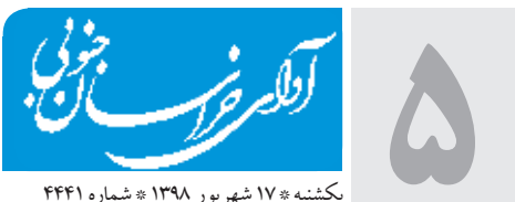
یکشنبه ۱۷ شهریور ۱۳۹۸ • شماره ۴۴۴۱

رئیس پلیس آگاهی استان همچنین از دستگیری ۲ سارق سابقه دار به اتهام ۸۰ فقره سرقت در شهرستان بیرجند خبر داد. سرهنگ "سید غلامرضا حسینی" افزود: سابقه دار دستگیر و به پلیس آگاهی منتقل کردند که متهمان دستگیر شده به سرقت بیش از ۸۰ منزل و اماکن خصوصی اعتراف کردند. وی با اشاره به این که دسترسی افراد نامطمئن به کلیدهای ساختمان و نصب نشدن دزدگیر مناسب در ساختمان از عواملی است که دسترسی سارقان را به اماکن