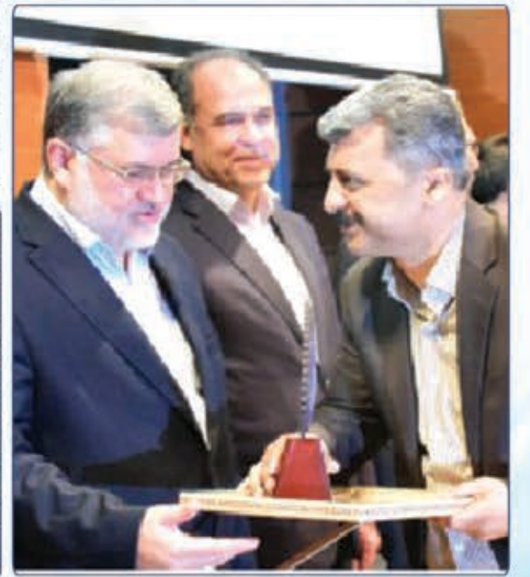
وزارت نیرو شرکت آب و فاضلاب خراسان جنوبی روابط عمومی و آموزش همکارانی www.ava724.ir