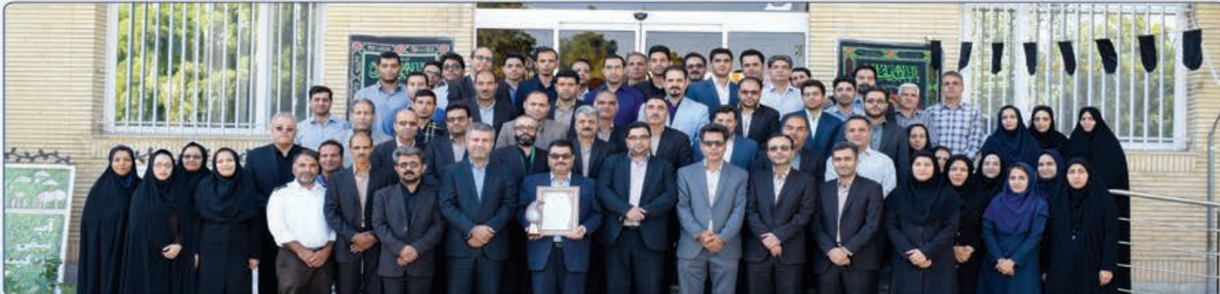
وزارت نیرو شرکت آب و فاضلاب خراسان جنوبی روابط عمومی و آموزش همکارانی www.ava724.ir