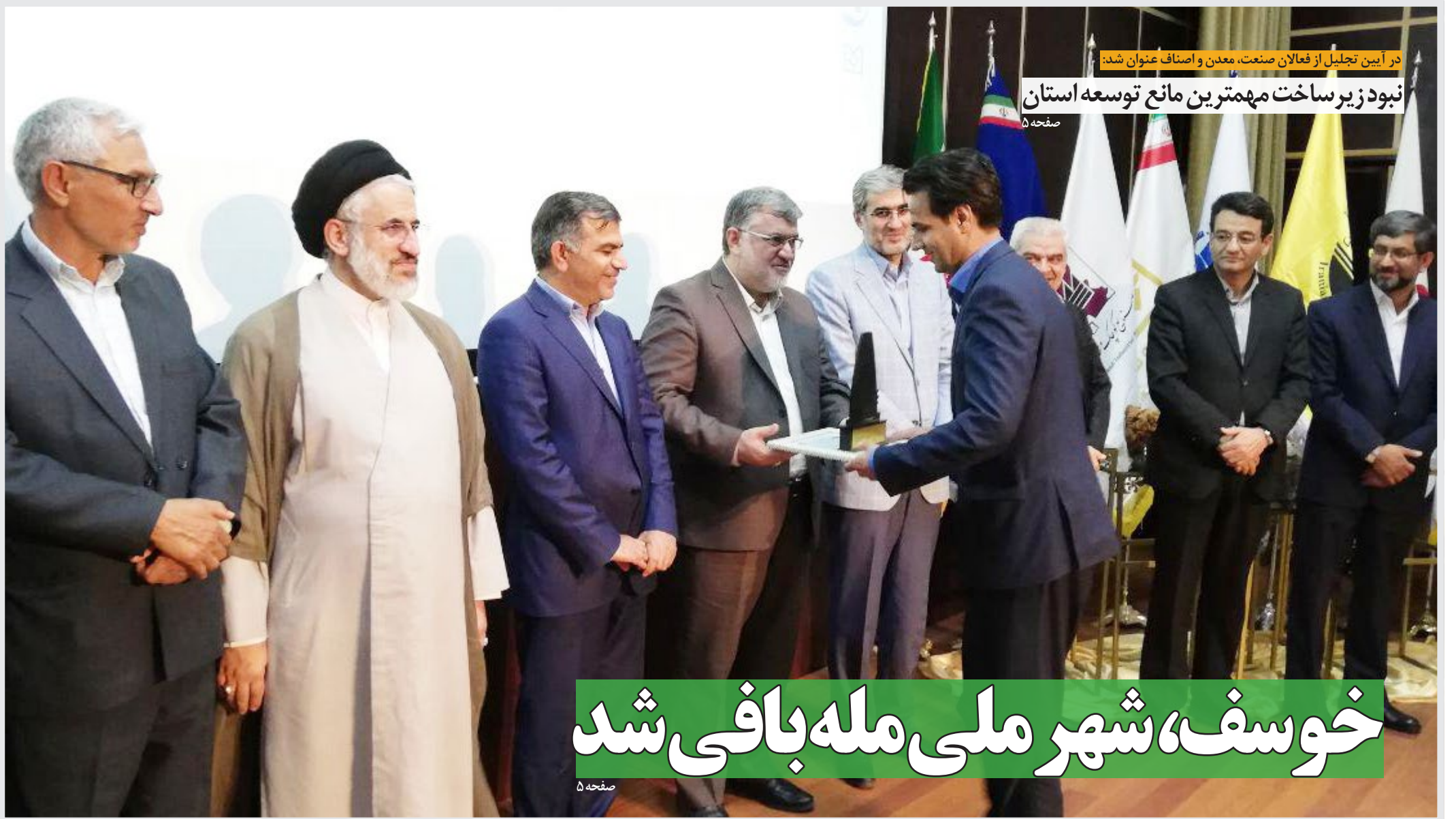
در آیین تجلیل از فعالان صنعت، معدن و اصناف عنوان شد: نبود زیر ساخت مهمترین مانع توسعه استان

خبر ازدواج «ها» کودک یازده ساله با مردی ۴۴ ساله در هلیلان از توابع استان ایلام، مدتی قبل با واکنش های شدید از سوی کاربران و فعالان حوزه کودک مواجه شد. خوشبختانه با اعتراضات فعالان اجتماعی و ورود دادگستری به این قضیه این مرد گرفتار قانون شد اما کودک همسری معضلی است که هنوز در کشور ما نیاز به فرهنگ سازی و قوانین بیشتری دارد. وقتی که یک دختر ۱۱ ساله با یک مرد ۴۴ ساله ازدواج می کند در واقع مرگ کودکی و بازی های کودکانه اوست. دوران کودکی و جوانی این دختر با پیرسالی همسرش... مشروح در صفحه ۲