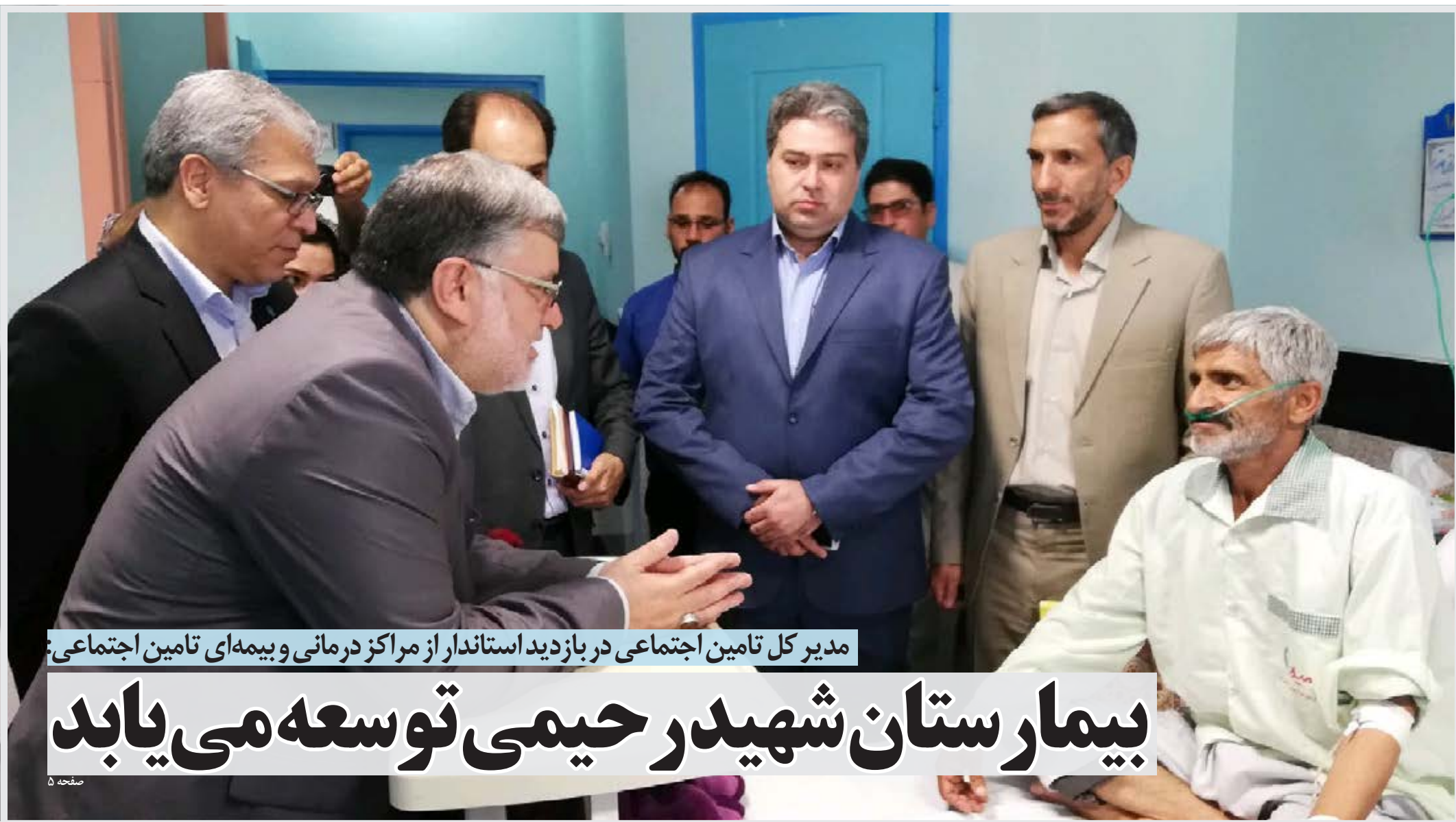
مدیر کل تامین اجتماعی در بازدید استاندار از مراکز درمانی و بیمه ای تامین اجتماعی

پنجشنبه ۲۷ تیر ۱۳۹۸ * ۱۵ ذی القعدة ۱۴۴۰ * ۱۸ جولای ۲۰۱۹