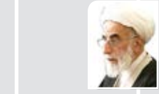
دبیر شورای نگهبان:

برای داوطلبان تأیید صلاحیت نشده حق اعتراض قائلیم