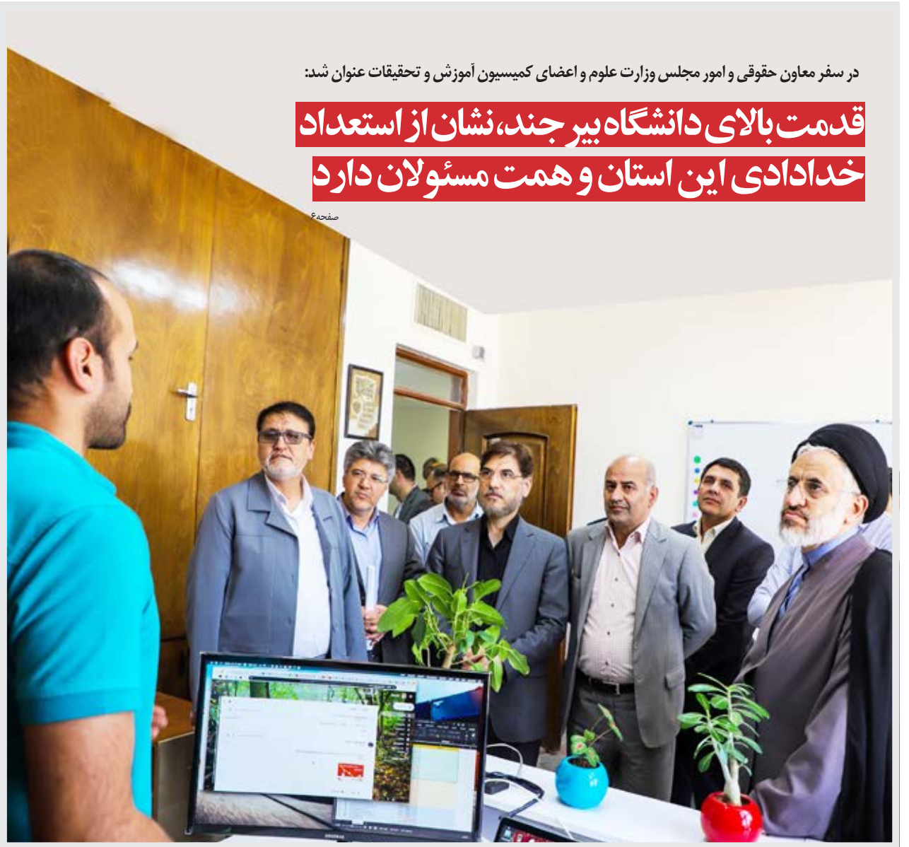
در سفر معاون حقوقی و امور مجلس وزارت علوم و اعضای کمیسیون آموزش و تحقیقات عنوان شد:

قدمت بالای دانشگاه بیرجند، نشان از استعداد