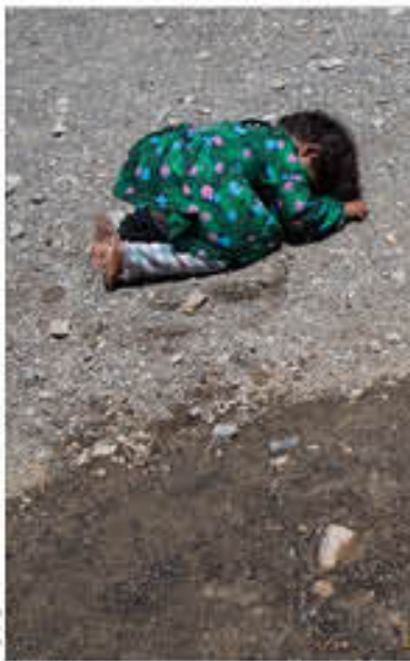
آب نایاب در محله‌های محروم است. در این مناطق مردم با کمبود آب مواجه می‌شوند.

بسیاری از روستاهای منطقه برای تأمین امنیت از چاه، چاه خشک دارد که مناسفه آب تمام این چشمه ما ۳۰ سال است بر روی زمین جاری است تا اینکه در پایین دست به زمین نفوذ می کند. به دلیل خشکسالی و نداشتن صرفه اقتصادی لوله‌ری مردم روستاهای یزدان و کویر خواجهان بارگشت به منطقه و استفاده از این منابع آبی برای کشاورزی هستند.