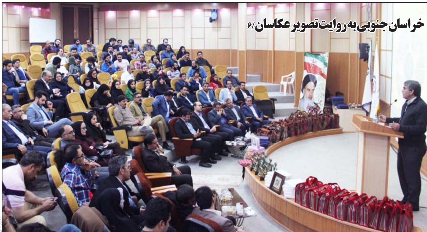
خراسان جنوبی به روایت تصویر عکاسان ۶/