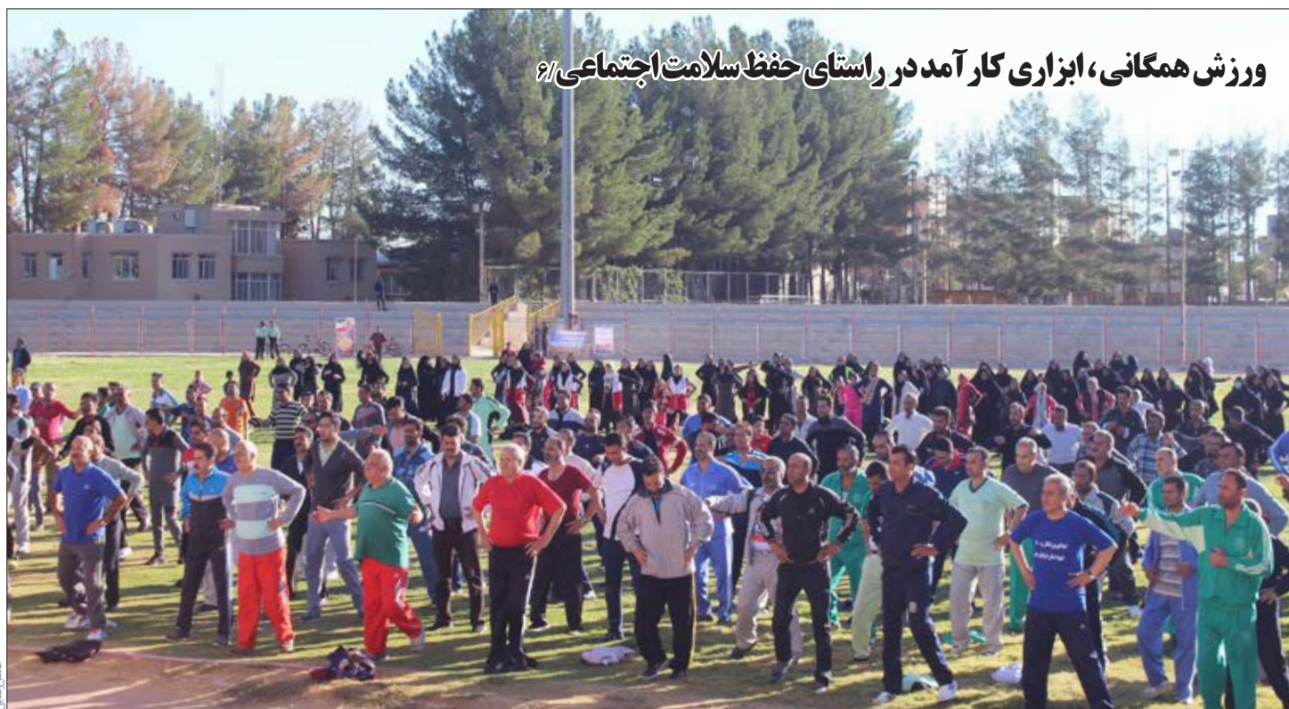
ورزش همگانی، ابزاری کارآمد در راستای حفظ سلامت اجتماعی