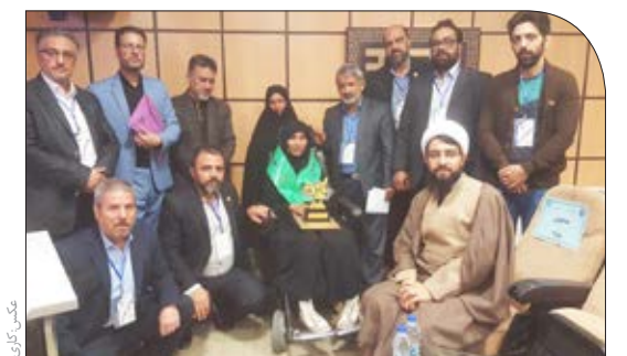
تجلیل از ۱۱۴ نخبه علمی از محل موقوفه بنیاد البرز ۳