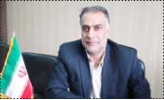
فارس‌مدیرکل تعاون، کار و رفاه اجتماعی با بیان

اینکه بانک اطلاعاتی برای شناسایی واجدین شرایط دریافت کالا برگ در استان وجود دارد اظهار کرد: واجدین شرایط این طرح تمامی مددجویان کمیته امداد و بهزیستی را شامل می‌شوند. رکنی افزود:اجرای طرح حمایت غذایی از ۹۴ سال توسط هیئت وزیران در جلسه مورخ ۱۱ خرداد سال ۹۲ تصویب شد وی با بیان اینکه بسته حمایت غذایی از سال ۹۳ تاکنون به‌مستمری‌گیران سازمان‌های‌حمایتی‌تعلق‌می‌گیرد، تصریح کرد: از ابتدای سال ۹۳ تا شهریور اسال ۱۴ مرحله سبد حمایت غذایی از طرف وزارت تعاون، کار و رفاه‌اجتماعی‌به‌مشمولان‌طرح‌واریز‌گردیده‌است،وی ادامه داد: این اداره کل هماهنگی‌ها و اطلاع‌رسانی آغاز فرآیند را به دستگاه‌های حمایتی در استان را انجام داده است.رکنی با اشاره به اینکه شناسایی افراد مشمول این طرح از طریق سازمان هدفمندی یارانه‌ها وسازمان‌های حمایتی و اعلام آن به وزارت تعاون، کار و رفاه اجتماعی جهت واریز سبد حمایتی غذایی انجام می‌گیرد، یادآور شد: ادارات کل تعاون، کار و رفاه اجتماعی استان‌ها تقشی در شناسایی افراد مشمول نادرندوی با بیان اینکه بانک اطلاعاتی برای شناسایی واجدین شرایط دریافت کالا برگ در استان وجود دارد، اضافه کرد: واجدین شرایط این طرح تمامی مددجویان کمیته امداد و بهزیستی را شامل می‌شود.