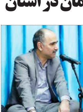
مدیرکل بیمه سلامت

هدف با کیفیت تر گسترش یافت و از این طریق هزینه های درمان به هزینه های واقعی نزدیک تر شد. وی بیان کرد در مجموع ماهانه ۱۹۰ هزار بیمه شده سلامت از خدمات سربایی و پنج هزار نفر از خدمات بخش بستری رایگان یا حداقل پرداختی بهره مند می شوند.رایابی گفت: