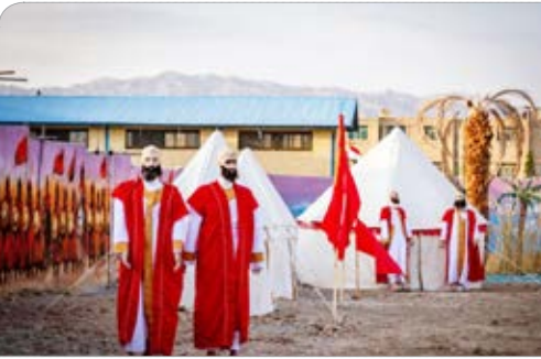
تماشاگاه «حرا تا حرم»