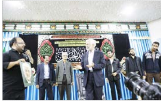
حضور عضو مجمع تشخیص مصلحت نظام در نشست تبیین ایجاد چهارمین سالگرد پیروزی انقلاب