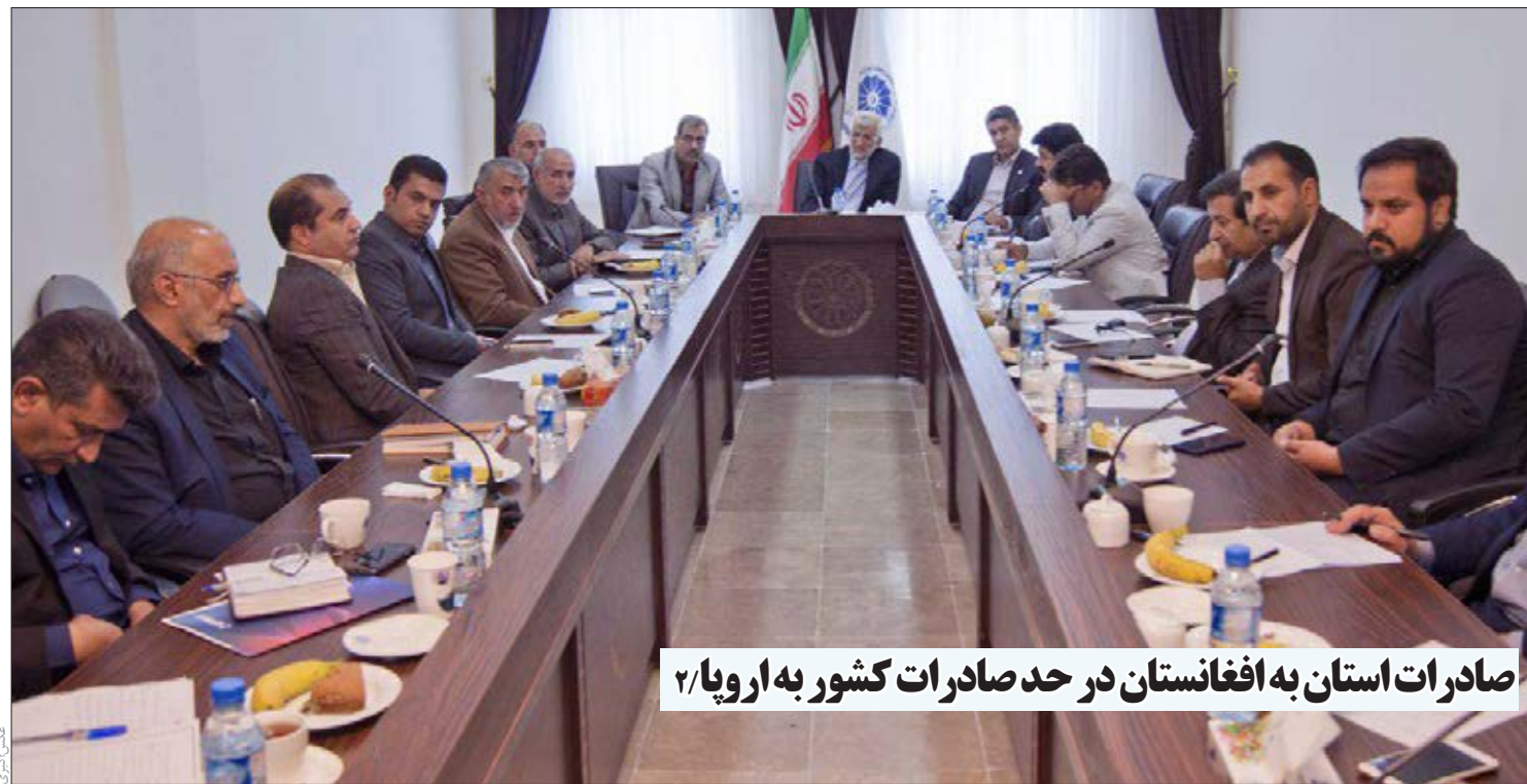
صادرات استان به افغانستان در حد صادرات کشور به اروپا/۲