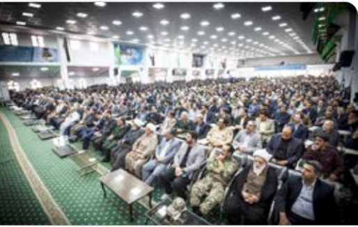
اجلاس اساتید و دانشجویان کنگره ملی ۲۰۰ شهید خراسان جنوبی