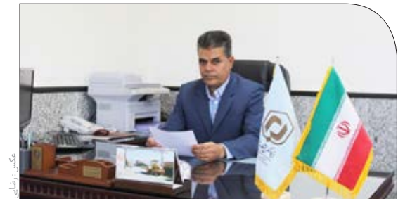
گزارش اقدامات بنیاد مسکن انقلاب اسلامی بیرجند ۶/