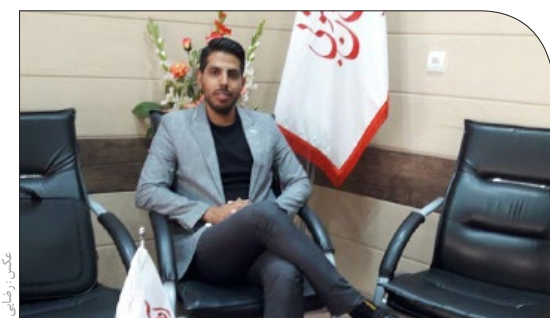
افتخاری دیگر برای خراسان جنوبی