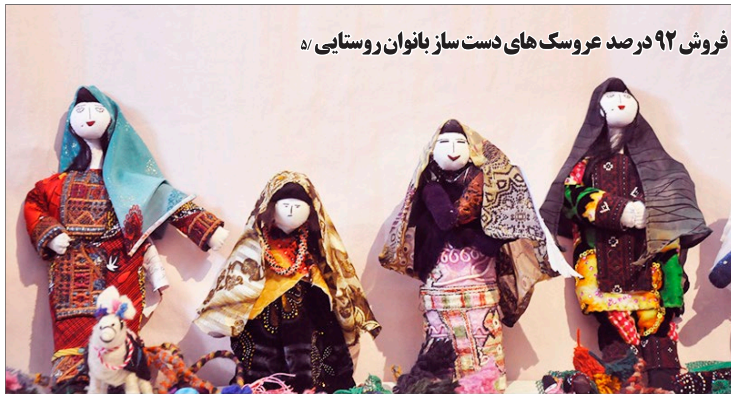
فروش ۹۲ درصد عروسک های دست ساز بانوان روستایی ۵/