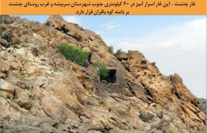
غار چنشت - این غار اسرار آمیز در ۶۰ کیلومتری جنوب شهرستان سریشه و غرب روستای چنشت بر دامنه کوه باقران قرار دارد.