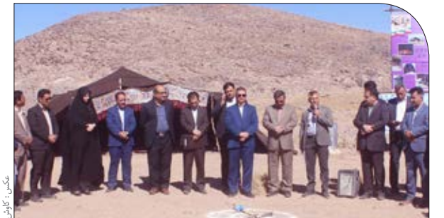
آغاز عملیات احداث ۴ اقامتگاه بومگردی در سریشه ۵/