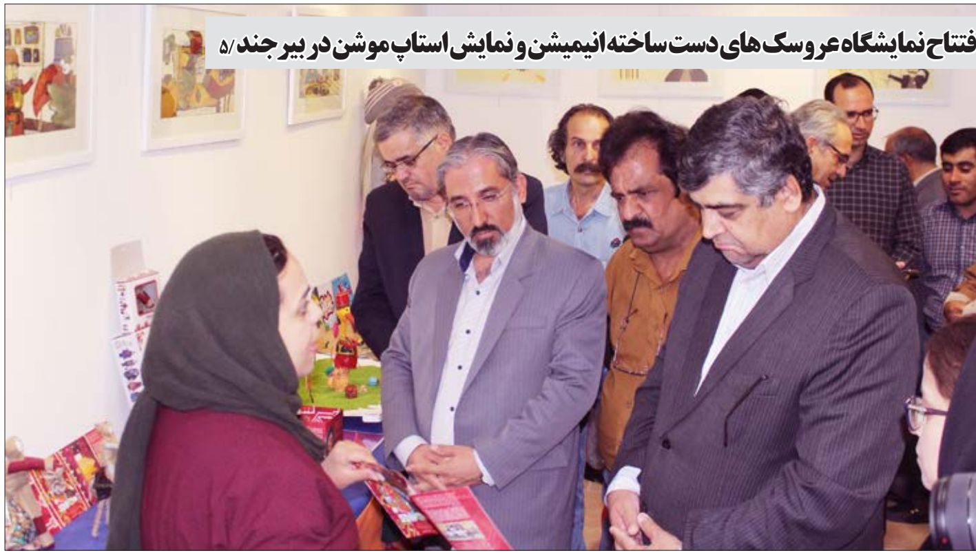
افتتاح نمایشگاه عروسک های دست ساخته انیمیشن و نمایش اسنپ موشن در بیرجند ۵/