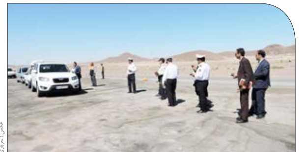
مسافران در ایستگاه پذیرایی متوقف می شوند ۵/