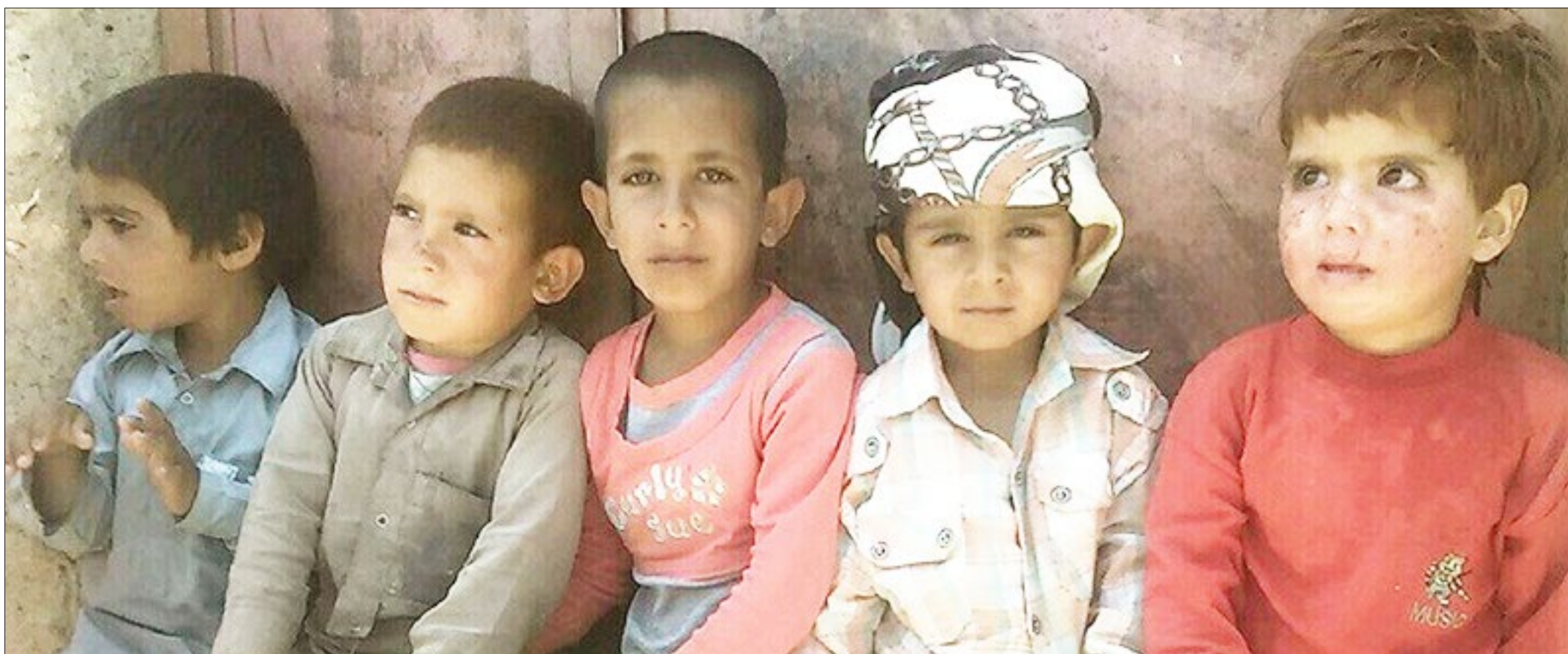
وقتی بی آبی زخم بر صورت زیبای کودکان می‌گذارد

اعتماد دوباره به اروپا ساده‌اندیشی و خبیانت است