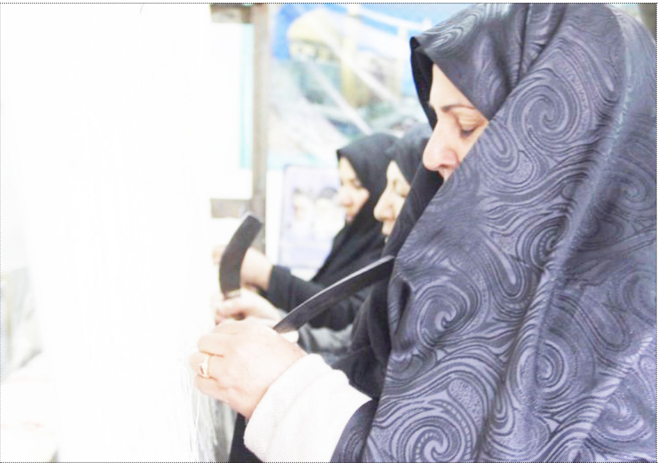
فرش در ایران