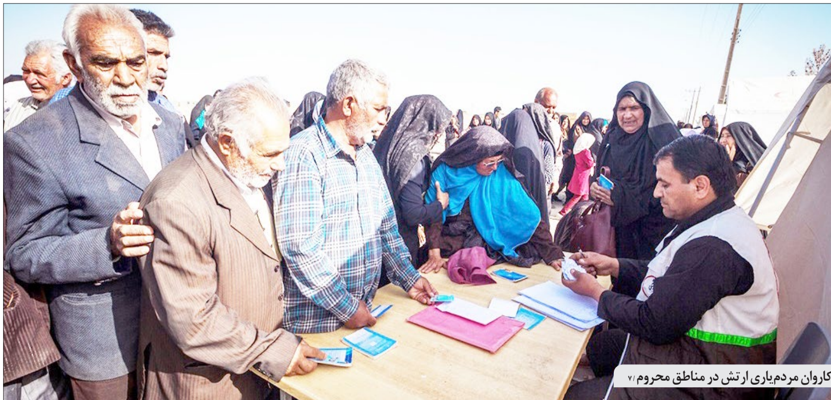
کاروان مردم‌باری ارتش در مناطق محروم ۷۱