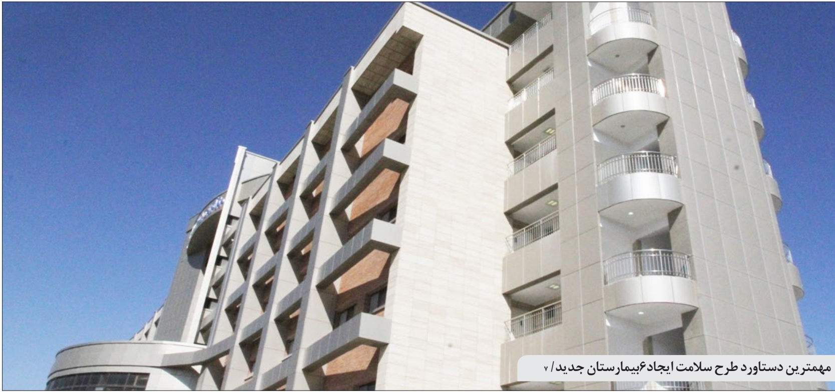
مهمترین دستاورد طرح سلامت ایجاد بیمارستان جدید / ۷

آغاز مرحله استانی هفتمین دوره مسابقات ملی مناظره در بیرجند