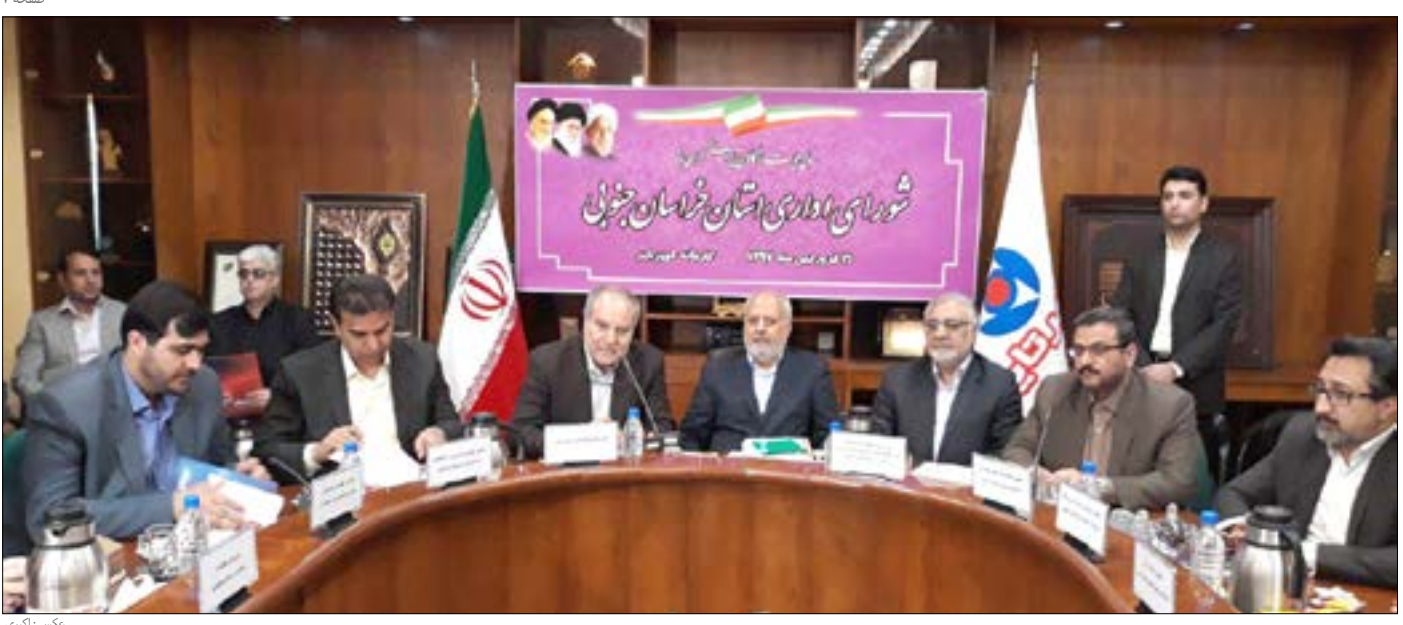
گام‌های بنیاد مسکن برای خانه دار شدن کم درآمدها پوشش ۷۱ درصدی ثبت احوال در صدور کارت ملی هوشمند ورودی مهر شهر باید تعیین تکلیف شود