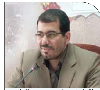
افزایش ۵۰ درصدی زائران حج تمتع از استان