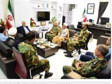
دیدار سردار شجاع فرمانده نیروی انتظامی استان با دکتر مروج الشریعه استاندار خراسان جنوبی