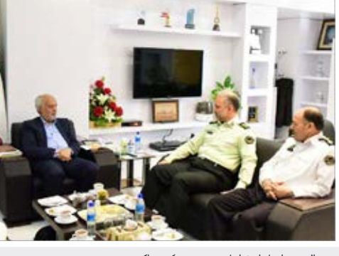
دیدار سردار شجاع فرمانده نیروی انتظامی استان با دکتر مروج الشریعه استاندار خراسان جنوبی