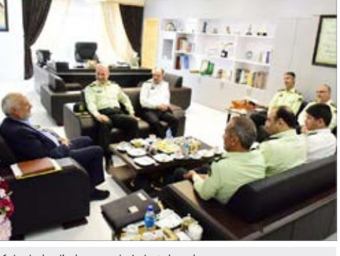
دیدار سردار شجاع فرمانده نیروی انتظامی استان با دکتر مروج الشریعه استاندار خراسان جنوبی