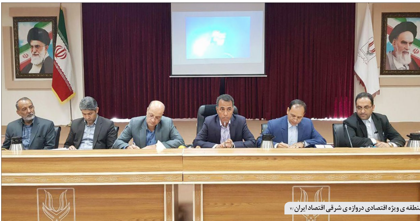
منطقه ی ویژه اقتصادی دروازه ی شرقی اقتصاد ایران ۷۱