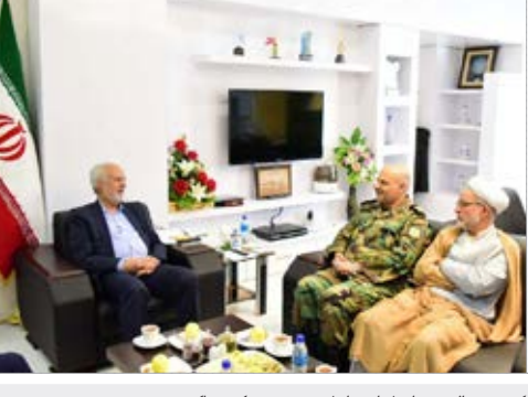
دیدار امیر قوام یوسفی فرمانده ارشد نظامی آجا در استان با دکتر مروج الشریعه استاندار خراسان جنوبی

وزیر امور خارجه کشورمان گفت: ایران یک گروه سیاسی فراگیر نیست، ما دیکتاتوری نداریم در حالی که آن‌ها دارند، ما در ایران صداهای زیادی داریم که شنیده می‌شود و بیان‌کننده دیدگاه صاحب‌است. وی افزود: ایران یک گروه سیاسی فراگیر نیست، ما دیکتاتوری نداریم در حالی که آن‌ها دارند، ما در ایران صداهای زیادی داریم که شنیده می‌شود و بیان‌کننده دیدگاه صاحب‌است.