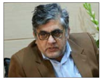
خامسان در گفتگوی اختصاصی با آوا:

هلال احمر استان ۲۰ تیم آموزش دیده با تخصص مهارتی ویژه دارد