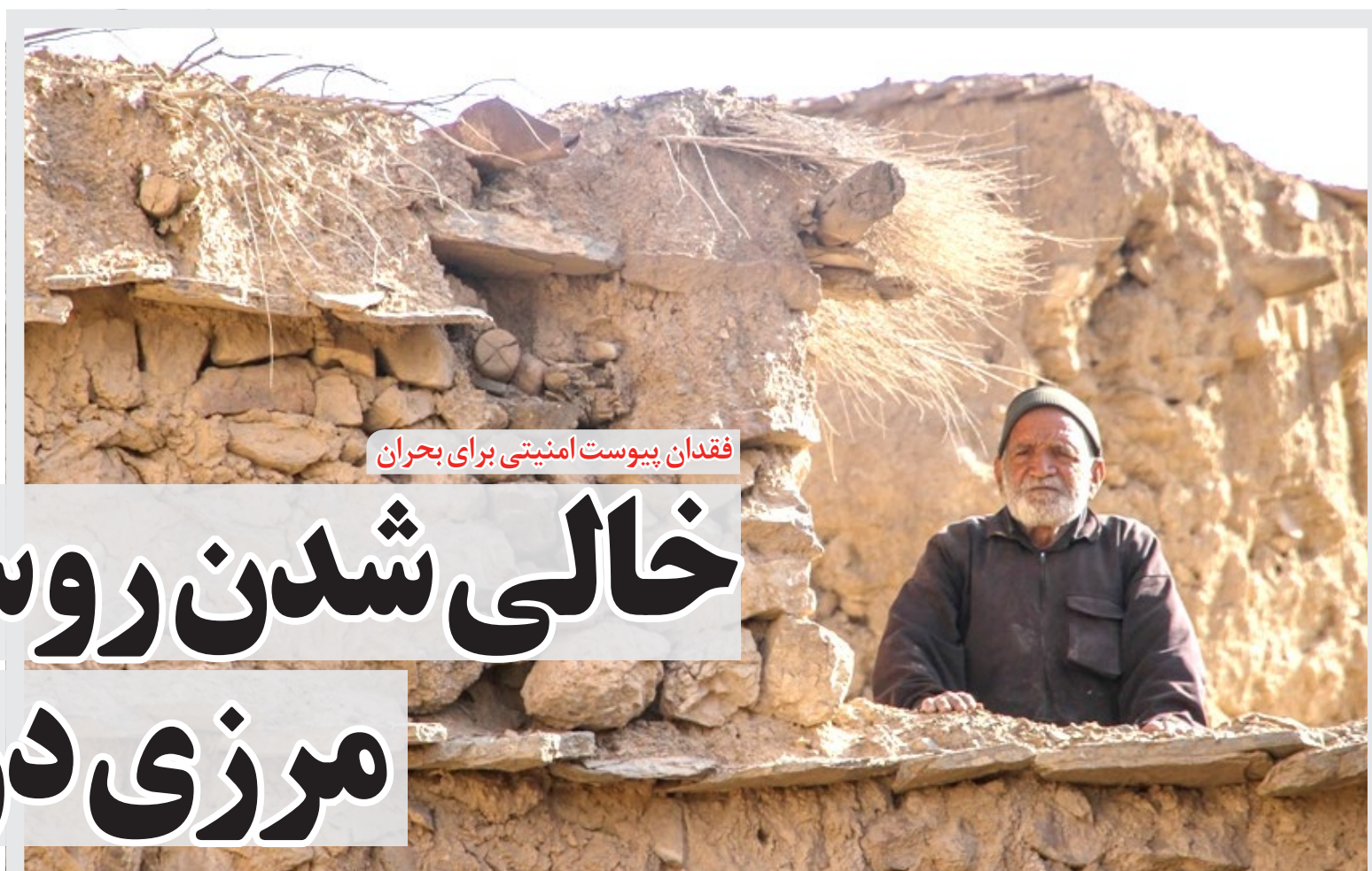
فقدان پیوست امنیتی برای بحران