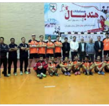
تیم هندبال زرگلستک طیس به لیگ دسته یک کشور صعود کرد

سردار غیب پرور رئیس سازمان بسیج مستضعفین گفت: ما کشوری هستیم که بیشترین انتخابات را داشته ایم و سالانه یک انتخابات در کشور برگزار کرده ایم. چگونه ممکن است کشور با یک انتخابات دچار حادثه قتل ۸۸ شود که کم هزینه هم نبود. وی افزود: مرور حوادث و مراجعه به آرشیو نشان می دهد که دشمنان از سال ۸۴ دنبال طراحی سناریوی قتل ۸۸ بودند که مطمئن هم بودند پیروز خواهند شد.