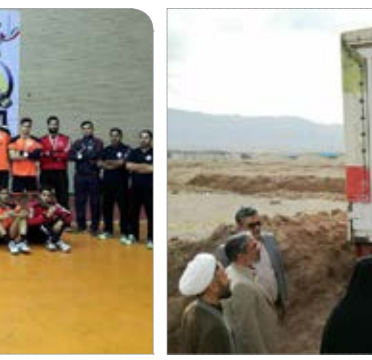
بازدید فرماندار بیرجند از محل ارسال چهارمین محموله کمک های اهدایی به مردم زلزله زده کرمانشاه