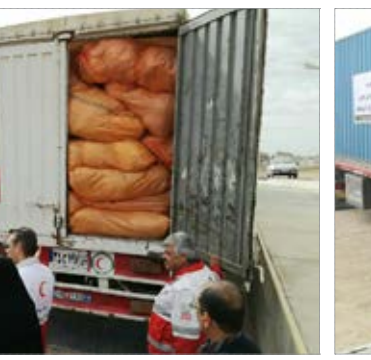
بازدید فرماندار بیرجند از محل ارسال چهارمین محموله کمک های اهدایی به مردم زلزله زده کرمانشاه