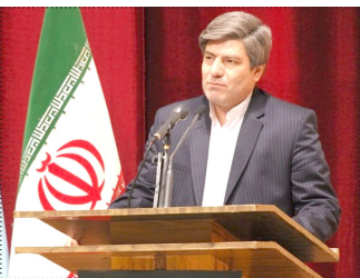
مراسم اختتامیه سومین جشنواره شعر طنز خراسان جنوبی

پیشه ور- مدیر کل فرهنگ ارشاد و اسلامی استان با بیان اینکه همزمان با برگزاری اختتامیه سومین جشنواره شعر طنز خراسان جنوبی از تفرات برتر این جشنواره