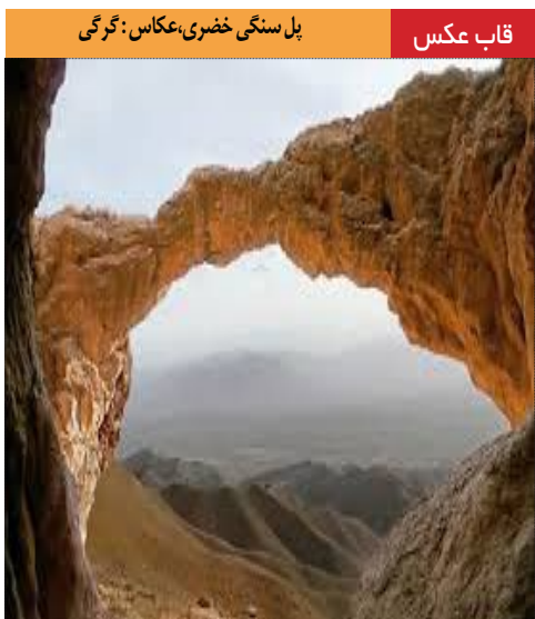
قالب عکس: بل سنگی خضری، عکاس: نگرگی