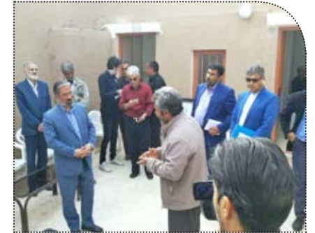
دعوت یک شهروند ساکن خیر آباد از مسئولان