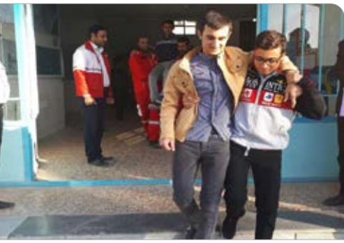
مانور زلزله با حضور امدادگران هلال احمر و دانش آموزان دبیرستان چمران بیرجند - ۲۳ آبان