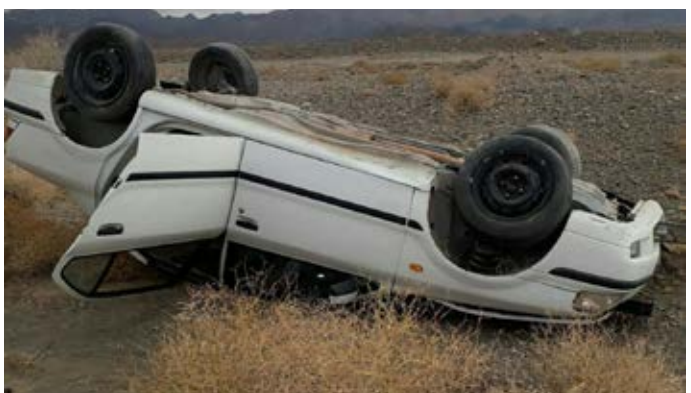
ظهر دیروز واژگونی خودروی سمند در محور گزیگ - آواز سه مصدوم بر جای گذاشت