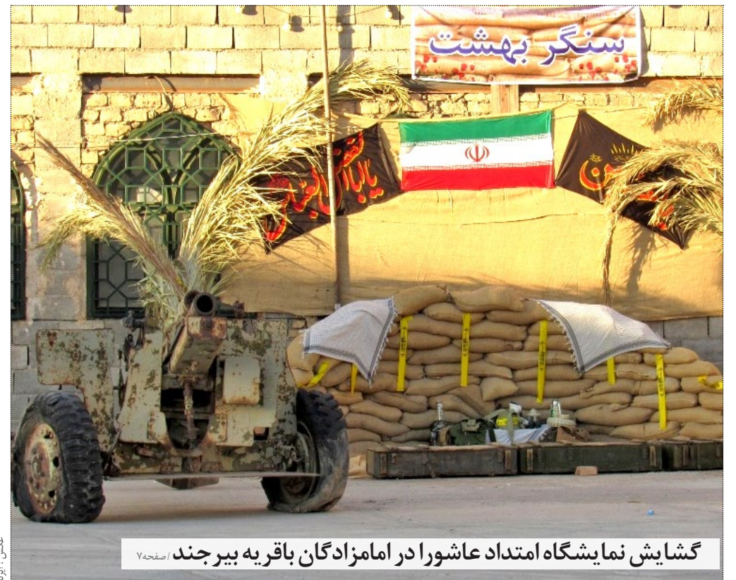
گشایش نمایشگاه امتداد عاشورا در امامزادگان باقریه بیرجند

رضایی - دیروز با حضور نماینده ولی فقیه، فرمانده انتظامی استان، معاون هماهنگ کننده ی سپاه انصارالرضاع) و چند تن از مسئولان برگزار شد. محوریت اصلی این جلسه به منظور بیان مسائل و برنامه ها هیئت های مذهبی در ده اول محرم و همچنین آگاه سازی نمایندگان هیئت ها برای ایجاد جریان صحیح عاشورایی و جذب هر چه بیش تر مردم و بخصوص نسل جوان در این ایام بود. نماینده ولی فقیه در استان عنوان کرد: جایگاه امام حسین بر هیچ کس پوشیده نیست و ایشان در بین تمام معصومین جایگاه استثنایی دارند و علاوه بر مسلمانان، کسانی که شاید اصلا مسلمان نیستند و هندو و زرتشتی هستند در این ایام برایشان نذر و نیاز می کنند و ایشان را الگویی در برابر ظلم ستیزی و استکبار ستیزی می دانند. وی افزود: حسین یک فرد و کربلا یک مکان نیست بلکه یک جریان است. جریان عدل در برابر ظلم. حجت الاسلام عبادی ادامه داد: طبق فرمایش مقام معظم رهبری که عزاداری امام حسین نباید عزاداری سکولار باشد هیئت ها و متولیان آن باید با برنامه ریزی... (ادامه خبر در صفحه ۷)