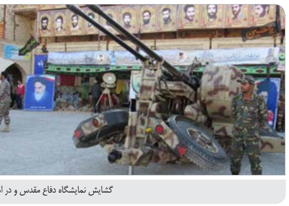
کاهش نمایشگاه دفاع مقدس و در امتداد عاشورا در بیرجند.