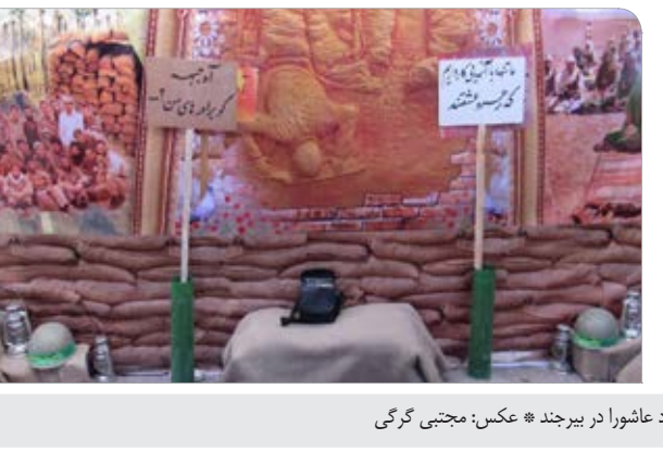
کاهش نمایشگاه دفاع مقدس و در امتداد عاشورا در بیرجند.