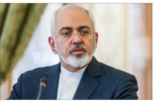
محمد جواد ظریف وزیر امور خارجه ایران در گفت‌وگو با شبکه «سی‌ان‌ان» گفت: عقب‌نشینی از برجام و بازگرداندن برنامه هسته‌ای به سرعت قبل، یکی از گزینه‌های ایران است.

محمد جواد ظریف وزیر امور خارجه ایران در گفت‌وگو با شبکه «سی‌ان‌ان» گفت: عقب‌نشینی از برجام و بازگرداندن برنامه هسته‌ای به سرعت قبل، یکی از گزینه‌های ایران است. ظریف در پاسخ به سولات «فرید زکریا» مجری سی‌ان‌ان تاکید کرد که تایید پایبندی یا عدم پایبندی ایران به برجام، بخشی از توافق هسته‌ای نبوده و یک موضوع داخلی برای دولت آمریکاست که نمی‌تواند رئیس‌جمهور «دونالد ترامپ» و دولت‌ش را از مسئولیت‌هایی که در قبال برجام دارد، فارغ کند. ظریف در بیان اینکه تهران به خروجی فرآیند تایید از سوی کاخ سفید توجه می‌کند، افزود: ایران گزینه‌های متعددی دارد، از جمله عقب‌نشینی کردن از برجام و بازگرداندن برنامه هسته‌ای به سرعت قبل، در بخش دیگری از این گفت‌وگو، زکریا پرسید و در ۴۰ سال گذشته این گونه واقعتاً ما هیچ جایگزینی نداریم. وی با تاکید بر اینکه واقعتاً ما منطقه ما روشن و شفاف است و در ۴۰ سال گذشته این گونه پیام شما به دونالد ترامپ چیست؟ ایالات متحده تصمیم گرفته از این واقعتاً ما، غفلت کند و به همین علت موفق نشده است. که به واقعتاً ما توجه کند؛