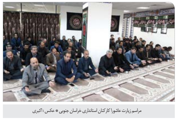
مراسم زیارت عاشورا کارکنان استانداری خراسان جنوبی.