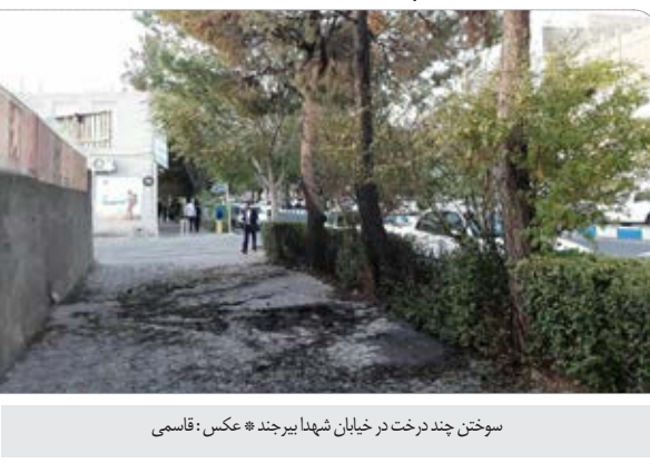
ساختن چند درخت در خیابان شهلا بیرجند.