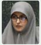
طیبه سیاوشی شاه عنایتی در جریان رای اعتماد به کابینه دوازدهم و موافقت با محمدجواد ظریف وزیر پیشنهادی امور خارجه، اظهار کرد: اقدامات ظریف نه تنها موجب دستیابی به توافق هسته‌ای شد بلکه زمینه خروج ایران از انزوای بین‌المللی را فراهم کرد. گسترش همکاری‌های سازنده با سایر کشورهای همسایه، ایران را تبدیل به بازیگر صلح‌ساز در عرصه سیاست منطقه‌ای کرده است.