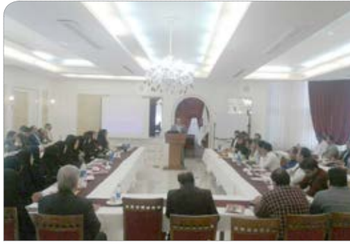
برگزاری دوره آموزشی (رویکردهای نوین در روابط عمومی)