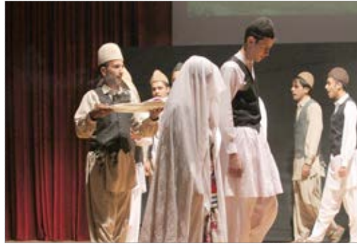
اجرای نمایش بیگانه در بیرجند