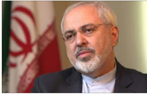
وزیر پیشنهادی امور خارجه محمدجواد ظریف وزیر پیشنهادی امور خارجه:

وزیر پیشنهادی امور خارجه گفت: برجام حاصل اعتماد به آمریکا نیست. جمله جمله آن نشانگر بی اعتمادی جدی ما نسبت به کرد اصل برتری غرب در جهان به سر آمده است. در دوران پسافرینی سیاست جهانی در چند قدرت بزرگ منحصر نمی‌شود. قدرت و ثروت در جهان در حال جابه‌جایی است. منطقه ما یکی از سخت‌ترین دوران‌های تاریخی خود را می‌گذراند برخی کنشگران منطقه‌ای سیاست‌های آمریکا از نخستین روز مذاکرات تا واپسین روز مذاکرات تا مسیر اجرای برجام بوده است. وزیر پیشنهادی امور خارجه اضافه کرد اصل برتری غرب در جهان به سر آمده است. در دوران پسافرینی سیاست جهانی در چند قدرت بزرگ منحصر نمی‌شود. قدرت و ثروت در جهان در حال جابه‌جایی است. منطقه ما یکی از سخت‌ترین دوران‌های تاریخی خود را می‌گذراند برخی کنشگران منطقه‌ای سیاست‌های آمریکا از نخستین روز مذاکرات تا واپسین روز مذاکرات تا مسیر اجرای برجام بوده است. وزیر پیشنهادی امور خارجه اضافه کرد اصل برتری غرب در جهان به سر آمده است. در دوران پسافرینی سیاست جهانی در چند قدرت بزرگ منحصر نمی‌شود. قدرت و ثروت در جهان در حال جابه‌جایی است. منطقه ما یکی از سخت‌ترین دوران‌های تاریخی خود را می‌گذراند برخی کنشگران منطقه‌ای سیاست‌های آمریکا از نخستین روز مذاکرات تا واپسین روز مذاکرات تا مسیر اجرای برجام بوده است.