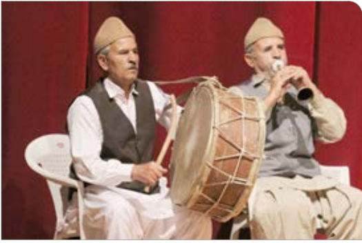
اجرای نمایش بیگانه در بیرجند