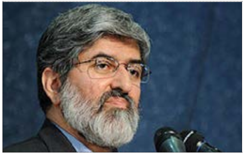
نایب رئیس مجلس شورای اسلامی علی مطهری: وزیر اطلاعات نمی‌تواند به بسیاری از سوالات نمایندگان پاسخ دهد.

علی مطهری اظهار کرد: ما نقص ساختاری در حوزه اطلاعات داریم که باعث کاهش قدرت نظارت مجلس و تضییع حقوق ملت مطرح است. وی با اشاره به اینکه ما نیاز به وزیر سوم داریم که زمینه رفع این نقص را فراهم کند، خاطر نشان کرد: ما باید وزیری را انتخاب کنیم که به سایر نهادها و سازمان‌ها اجازه دخالت در حیطه کار وزارت اطلاعات را ندهد. قانون هم همین را می‌گوید. نایب رئیس مجلس شورای اسلامی افزود: در چند سال اخیر دایره کار این نهاد البته با انگیزه پاسداری از انقلاب اسلامی وسیع‌تر شده است و به موضوع رسانه‌ها و مطبوعات و ... گسترش پیدا کرده و