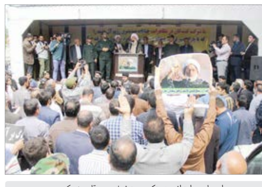
راهپیمایی در اعتراض به حکم حرمت شیخ عیسی قاسم