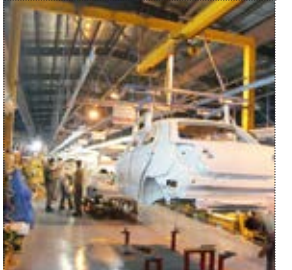
میلیون و ۵۰۰ هزار تومان معامله می‌شود. وی با بیان اینکه برخی از خودروهای تولید داخل کشور امروز در بازار بین‌المللی از رده خراج محسوب می‌شوند گفت: مصرف‌کنندگان خواهان کاهش قیمت و افزایش کیفیت خودروهای تولیدی هستند اما هیچ‌گونه افزایش کیفیتی در خودروهای داخلی دیده نمی‌شود.

رئیس اتحادیه فروشندگان خودرو با اشاره به تفاوت قیمت خودروها در کارخانه و بازار افزود: سمند LX در کارخانه ۳۹ میلیون و ۸۰۰ هزار تومان و در بازار ۴۱ میلیون تومان، ساندرو اتوماتیک در کارخانه ۴۹ میلیون و ۶۰۰ هزار تومان و در بازار ۵۳ میلیون و ۸۰۰ هزار تومان، استپ وی در کارخانه ۵۴ میلیون و ۵۰۰ هزار تومان و در بازار ۶۲