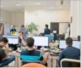
مهر - مدیر رسته فناوری اطلاعات طرح تکاپو در وزارت کار با اشاره به ظرفیت یک میلیون نفری اشتغال بخش فناوری

(ادامه سرمقاله در صفحه ۱) از آموزش ال‌هی محروم بماند با گرسنگی و تشنگی خود در این ماه گرسنگی و تشنگی روز قیامت را یاد کنید؛ به نیازمندان و بی‌نیوایان صدقه بدهید؛ به بزرگان خود احترام، و بر کوچک‌هایتان ترخم، و به بسنگانان نیکب کنید. زبانتان را نگه دارید؛ در این ماه نیز باید از این خون الهی توشه پختی بردارید و با روزه داری و اسماک اخورذن و آشنامین تلاوت هر چه بیشتر قرآن افطاری و صدقه دادن و دیگر عباداتی که در این خصوص در کتب دینی است خود را به خدا نزدیک تر کرده و خودساخته و تقوی پیشه کنید. روزه داری و نماز جماعت و سایر عبادات ظاهری دارند و باطنی. شایسته است که به باطن و محتوی عبادات بخصوص عبادات جمعی توجهی بیشتر شود. استنامطهری در تالیفاتش اشاره ای دارد به فلسفه نماز جماعت و داستانی را نقل میکند و میفرماید: نفردی نیازمند بر خورد میکند به کسی که در حال مهیا بودن برای نماز جماعت بود و بر ای اینکه به نماز جماعت برسد دست رد به سینه نیازمند میزند و می‌رود برای اینکه به نماز جماعت برسد صورتیکه نماز جماعت زمینه و بستر انجام عبادات و امور جمعی است و برای تقویت روحیه همکاری و دستگیری دیگران است. ماه بابرکت رمضان هم زمینه ای است که در خوردن چرب و شیرینهای دنیا افراط و اسراف نکنیم و به حداقلها اکتفا نماییم. وقناعت پیشه نماییم و با این کارها بیاد تشنگی و گرسنگی آخرت و بیاد گرسنگان و فقرا باشیم. هم اسماک کنیم و هم به دیگران و بخصوص فقرا افطاری بدهیم و حس دیگر خواهی و مسؤلیت و موماسات و غمخواری و همدردی با دیگران در ما تقویت شود. شاکر نعمتهای الهی باشیم.