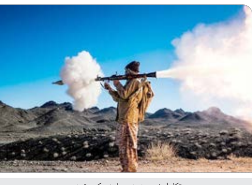
تکاوران نیروی زمینی سپاه