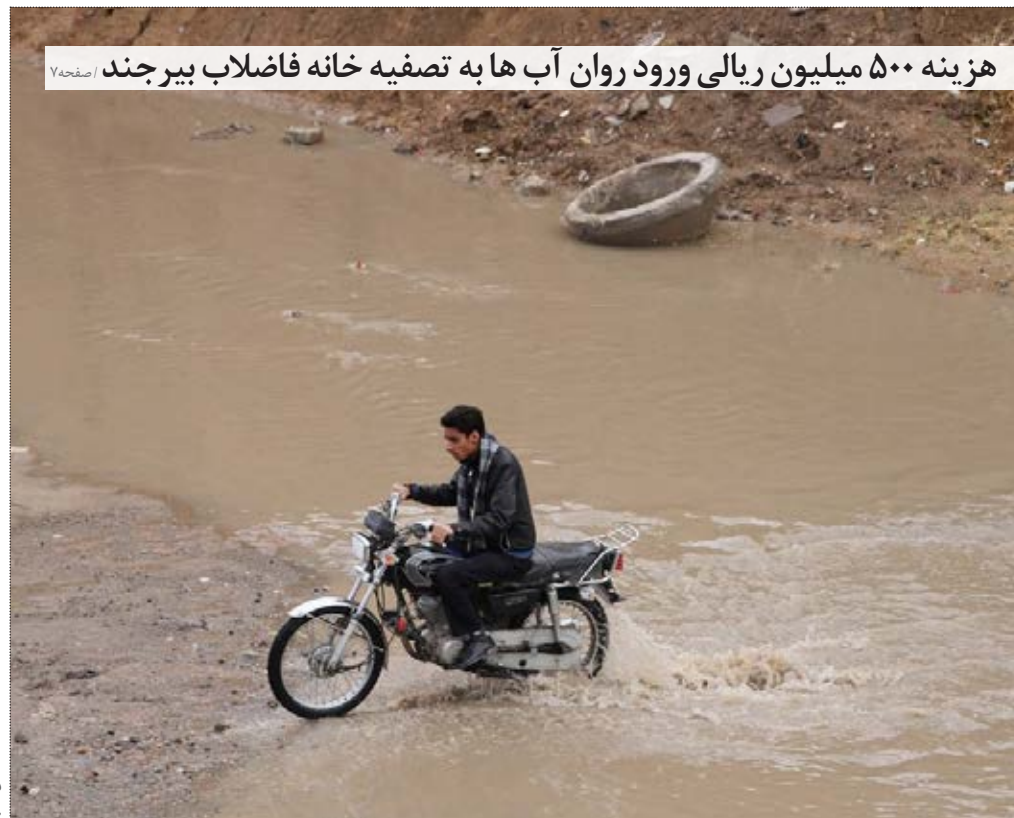
هزینه ۵۰۰ میلیون ریالی ورود روان آب ها به تصفیه خانه فاضلاب بیرجند

مصمام- در پی درج خبر «گوشت استان در وضعیت سفید» که نرخ گوشت کیلویی ۳۱ هزار تومان مصوب شده بود، چند تن از قصابان شهر نامه ای را امضا شده به دفتر روزنامه آوای خراسان جنوبی آوردند. در متن نامه آمده است: «گوشت گوسفند نرینه هر کیلوگرم مخلوط ۳۱ هزار تومان نرخ گذاری گردیده است و تمام اعضا موظف به رعایت نرخ می باشند، لذا همه اعضا و امضا کنندگان نامه نسبت به نرخ تعیین شده اعتراض داشته و قیمت تمام شده گوشت خیلی بیشتر از نرخ اعلام شده می باشد. این اعضا تا تاریخ ۱۰ خرداد ۹۶ گوشت شهروندان توسط قصابی ها تامین خواهند کرد تا نرخ اصلی گوشت تعیین گردد و از آن تاریخ به بعد این جانبان قادر به تامین گوشت نخواهند بود. اینجانبان حاضریم گوشت گوسفند نری که کمیسیون به قیمت ۳۱ هزار تومان در اختیار ما قرار دهد را در ایام ماه مبارک رمضان بدون هیچ گونه سودی توزیع نمایم. از تاریخ ۱۰ خرداد ۹۶ در صورت کمبود گوشت هیچ یک از این اعضا جوابگوی شهروندان نخواهند بود.» ... (ادامه خبر در صفحه ۷)