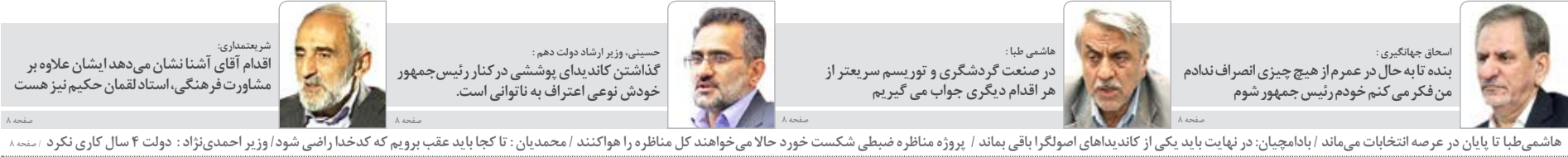
هاشمی طبیا تا پایان در عرصه انتخابات می ماند / بادامچیان: در نهایت باید یکی از کاندیداهای اصولگرا باقی بماند / پروژه مناظره ضبطی شکست خورد حالا می خواهند کل مناظره را هواکنند / محمدیان: تا کجا باید عقب برویم که کدخدای راضی شود/ وزیر احمدی نژاد: دولت ۴ سال کاری نکرد / صفحه ۸

@avane724 هر شب قبل از توزیع نسخه کاغذی روزنامه آوا را ( روی گوشی خود ) بخوانید