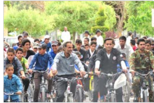
همايش دوچرخه سواری به مناسبت ميمث رسول اکرم(ص) در شهر قاين