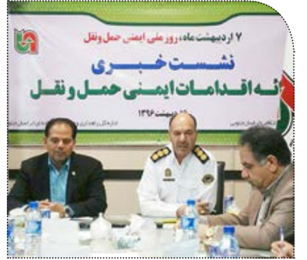
مدیرکل راهداری و حمل و نقل جاده‌ای با تاکید بر اولویت ایمن سازی راه های ۵ شهرستان استان :