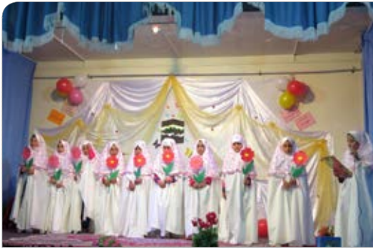
برگزاری جشن تکلیف دانش آموزان دختر مدرسه ۳۳ بهمن اسدیه

حسینی، وزیر ارشاد دولت دهم گفت: گذشتن کاندیدای پوششی در کنار رئیس جمهور خودش نوعی اعتراف به ناتوانی و نداشتن عملکرد است. وی ادامه داد: در این که می‌شود وضع کشور را بهتر کرد، هیچ تردیدی وجود ندارد و می‌شود کارهای خوبی را شروع کرد، همین که افراد پرتوان و پرتلاشی را سر کار بگذارید و جلوی مفاسد را بگیرید خودش خیلی مسایل را حل خواهد کرد.