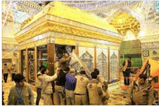
ضريح جديد امامين عسكرين (ع) - سامرا - عکس: تسنيم