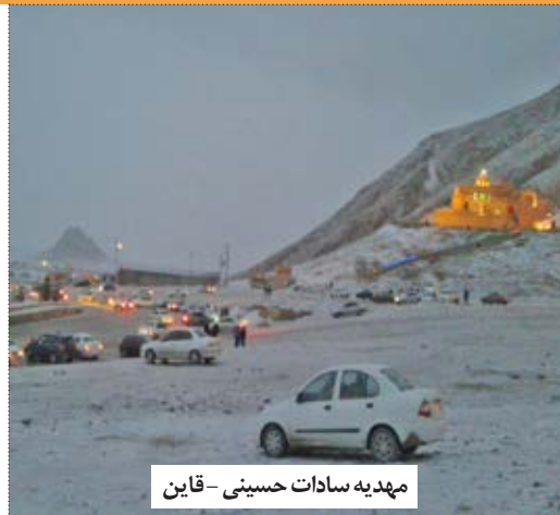
مهدیه سادات حسینی - قاین