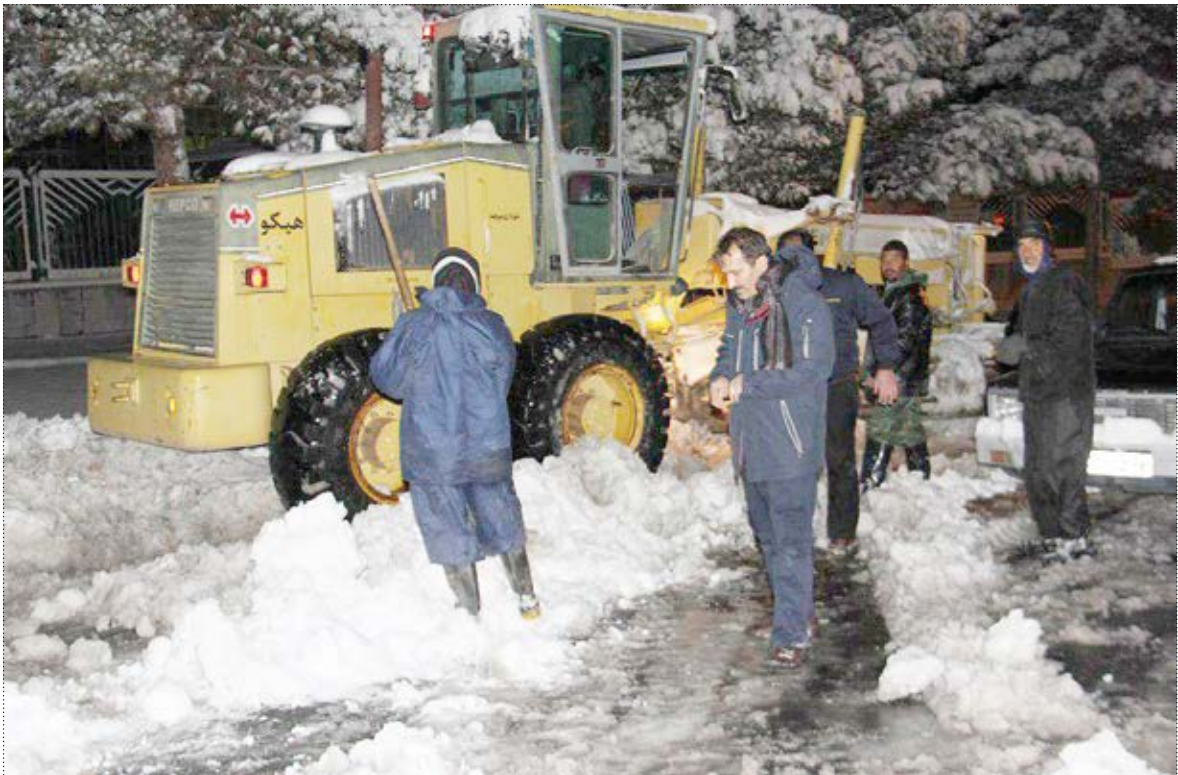
شهرداری بیرجند در حال پاکسازی خیابانها از برف

نداشتند اظهار کرد: متأسفانه به دلیل عدم همکاری برخی ارگانها، مجبور به اجاره ی ماشین آلات بخش خصوصی سایر شهرها شدیم. دکتر مدیح گفت: علی رغم اینکه بسیاری از نهادها امکانات و ماشین آلات در اختیار دارند