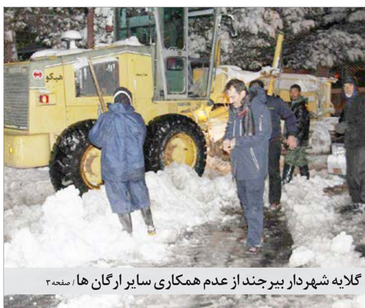
گلایه شهردار بیرجند از عدم همکاری سایر ارگان ها / صفحه ۳