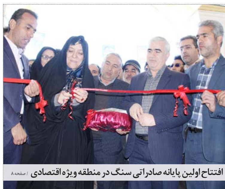
افتتاح اولین پایانه صادراتی سنگ در منطقه ویژه اقتصادی / صفحه ۸