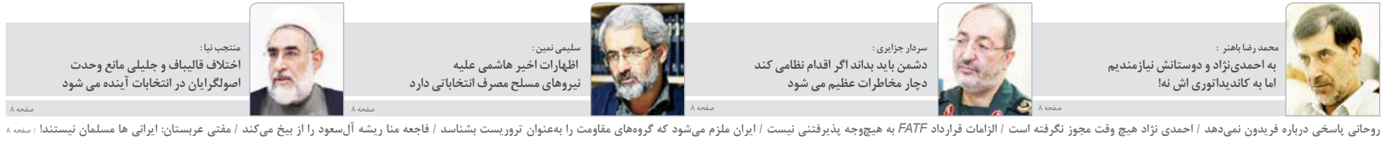
روحانی پاسخی درباره فریبون نمی دهد / احمدی نژاد هیچ وقت مجوز نگرفته است / الزامات قرارداد FATF به هیچ وجه پذیرفتنی نیست / ایران ملزم می شود که گروه های مقاومت را به عنوان تروریست بشناسد / فاجعه منار ریشه آل سعود را از بیخ می کند / مفتی عربستان: ایرانی ها مسلمان نیستند / صفحه ۸

رئیس انجمن صنفی واحدهای اقامتی خراسان جنوبی از رشد قابل توجه ... (مشروح خبر در صفحه ۷)