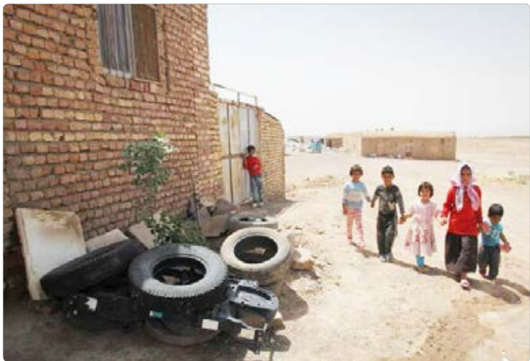
عکس روز | ایرنا - حاشیه نشینی در بیرجند به دلیل ۱۷سال خشکسالی در روستاهای استان رو به افزایش است

عبدالعزیز آل شیخ، مفتی وهابی سعودی در ادامه یابوه کویبی های مقام های سعودی مدعی شد: ایرانی ها مسلمان نیستند! (۱) به گزارش میزان، این شیخ وهابی ادعا کرد که خصومت ایرانی‌ها با مسلمان از زمان های قدیم وجود داشته است. آل شیخ در ادامه اظهارات مضحک خود مدعی شد که مسلمانان به عربستان درباره خدمت رسانی به حرمین شریفین اطمینان دارند.