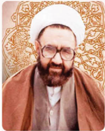
«شرح منظومه» و «سفار» (در فلسفه)