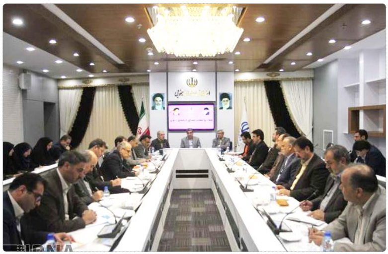
برگزاری نشست شورای امور عشایری خراسان جنوبی در بیرجند.

تحلیلگر مطرح جهان عرب نوشت: «عربستان، ایران را در یمین غافلگیر کرد» (۱) وی گفته که عربستان، ایران را باری دیگر در سوریه هم غافلگیر خواهد کرد. فیصل القاسم افزود: «غافلگیری در سوریه به مراتب بزرگتر از یمین خواهد بود».