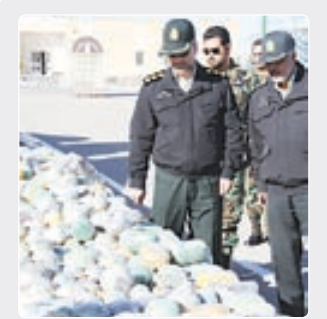
طی ۱۰ روز اخیر محقق شد: