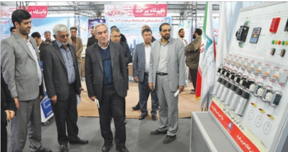
افتتاح نمایشگاه دستاوردهای پژوهش، فناوری خراسان جنوبی

وزیر تعاون: حذف یارانه ۲ میلیون و ۹۴۳ هزار نفر