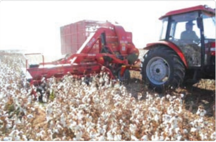
پنبه شهرستان بشرویه از محصولات با کیفیت کشور

رئیس مرکز تحقیقات استراتژیک مجمع تشخیص مصلحت با اشاره به اظهارات اخیر اردوغان گفت: به مقامات این کشور توصیه می کنیم موضع مدبرانه بگیرند درغیر این صورت به مصلحتشان نخواهد بود. ولایتی تصریح کرد: هر کسی باید در حد و اندازه خودش حرف بزند و همه باید بدانند که ایران یک قدرت تأثیرگذار منطقه ای است.