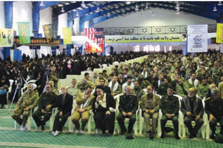
برگزاری همایش شکوه ایستادگی با حضور بیش از ۵ هزار بسیجی

آیت ... موحدی کرمانی گفت: سران کشورها به ویژه آقای پوتین رئیس جمهور روسیه مجذوب رهبری بودند و از رهبر فرزانه انقلاب تجلیل کردند چرا که رهبری اینچنینی را در دنیا ندیدند.