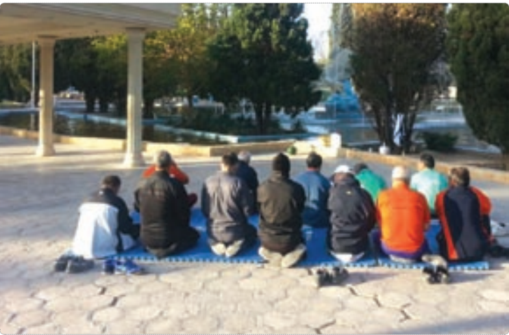
عکس روز: قرانت زیارت عاشورا توسط سخنران ورزشکار در پارک توحید بیرجند

وزیر دفاع روسیه تاکید کرد: فعالیت های مربوط به افراط گرایی مذهبی تحت عنوان داعش اخیراً به طور چشمگیری افزایش یافته است. ژنرال سرگنی شویگو گفت: روسیه نمی تواند اجازه دهد تهدید داعش به روسیه یا متحدان ما برسد.