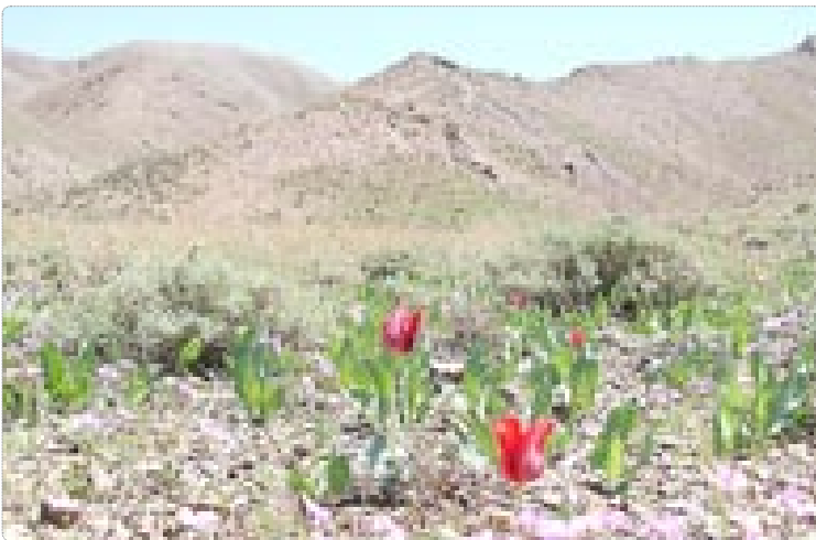
طبیعت کویر لوت

سفیر سعودی در آمریکا در واکنش به طرح چهارماده‌ای ایران برای حل و فصل اوضاع یمن گفت: نیازی به طرح ایران در ارتباط با یمن نیست. ظریف وزیر خارجه کشورمان طرح چهار ماده‌ای را برای حل بحران یمن مبتنی بر ارتش سن فوری، امدادرسانی، گفت‌وگو یعنی - یعنی و تشکیل دولت فراگیر را ارائه کرد که مورد استقبال جنبش انصار... یمن قرار گرفت.