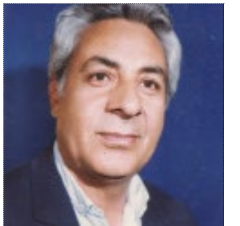
اشک ریز از دیدگان از خون دل بر میهمان که فقط اشب علی میهمان بود بر دوستان

شاید شما هم، به روزی فکر کنید که به رویای خود رسیده اید. این صحنه رویایی را صرفاً در فیلمها می توان دید. در دنیای واقعی افراد شکست خورده و ورشکسته ای که از دست طلبکاران خود در گریز هستند، بیشتر این شانس را دارند که در سکوت و تنهایی، چنین لذتی را تجربه کنند. هنوز کسانی را پیدا می کنید که می گویند اگر به سطح مطلوب موفقیت خود برسند، دیگر بیش از حد تلاش نمی کنند. آنها می گویند از زندگی لذت ببرند. آنها افراد موفق و ثروتمند اطراف خود را به حرص و طمع متهم می کنند و معتقدند که دارایی آنها برای پشتیبانی از چند نسل بعدی شان هم کافی است. اما هنوز نمی توانند متوقف شوند.