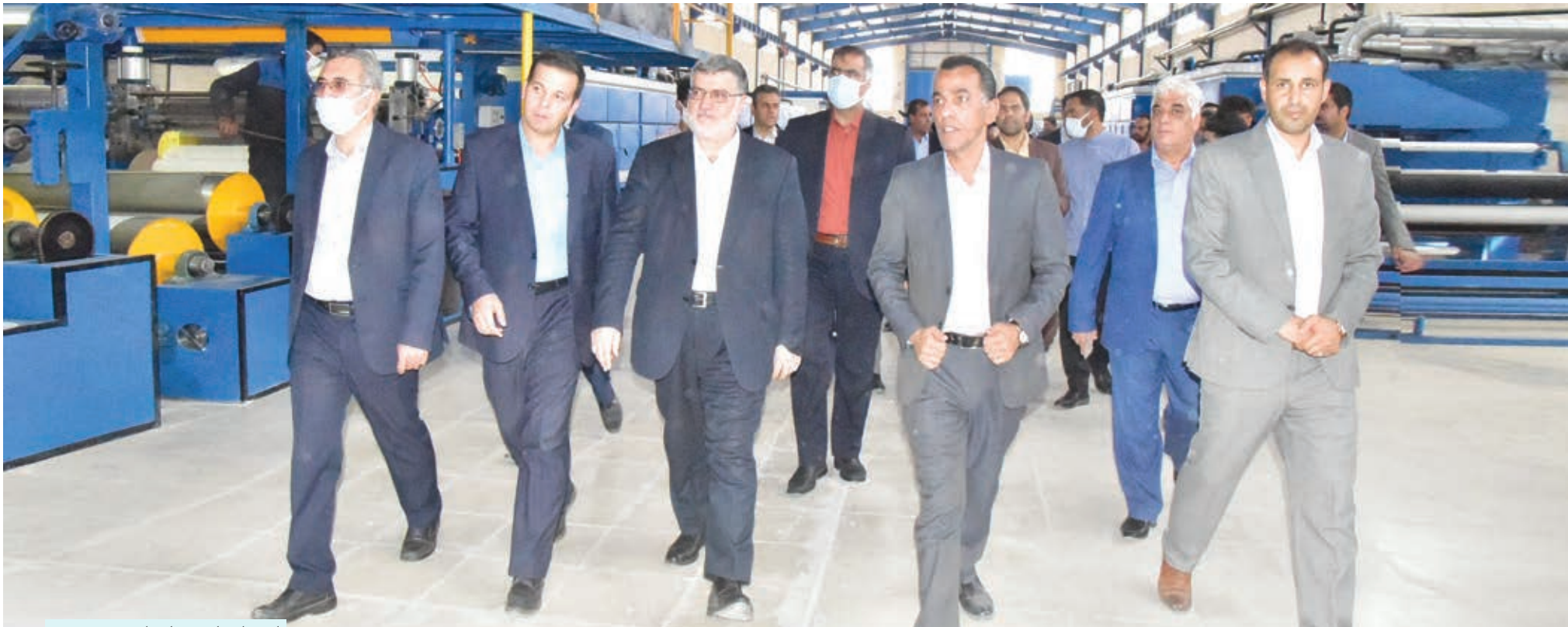
استاندار خراسان جنوبی:

تندروها در کاخ سفید می خواهند ایران را وسوسه به حمله علیه ریاض کنند! یک رسانه آمریکایی نوشت: تحلیل در رابطه با تصمیم اخیر آمریکا برای کاهش حضورش در عربستان این است که این امر می تواند تهران را به یک اقدام نظامی وسوسه کند. اقدامی که می تواند پاسخی محکم تر از جانب آمریکا را توجیه کند. آن ها امیدوار هستند که کاهش نیروهای آمریکایی، تهران را در انجام حرکات تهاجمی تر وسوسه کند و این امر متعاقبا واکنش شدید آمریکا را توجیه کند.