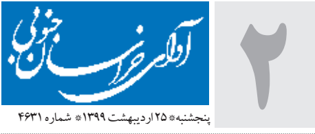
پنجشنبه ۲۵ اردیبهشت ۱۳۹۹ هـ شماره ۴۳۱