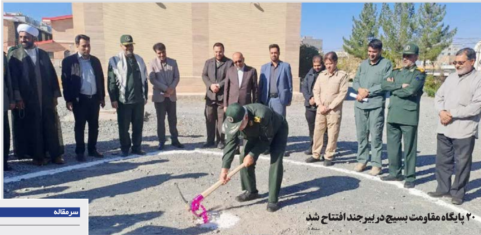
۲۰ پایگاه مقاومت بسیج در بیرجند افتتاح شد