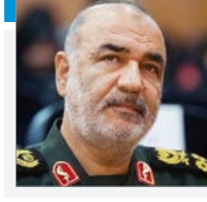
فرمانده کل سپاه با بیان ۱۳ روزها در اسرائیل کسی آرامش ندارد و همه در پناهگاه به سر می برند و لرزه بر اندام دشمنان افتاده است، گفت: اسرائیل آشفته است، آنها افسرده شده اند و ارتش آنها خسته شده و به عکس موتور

حزب... و چپه مقاومت روشن شده است. سر لشکر سلامی افزود: اسرائیل همچون یک خنجر جا گرفته در دل مسلمانان باید از پیکره اسلام جدا شود. ادامه این جنگ فقط به نایبوی اسرائیل می انجامد و اگر مسلمانان با هم متحد شوند این جرثومه فساد نابود خواهد شد و قطعاً این راه طی خواهد شد. با نگاه به سونوشت پیشینیان خواهیم دید که نایبوی در انتظار اسرائیل است؛ مردم ایران مطمئن باشند که انتقام خود را از اسرائیل خواهیم گرفت.