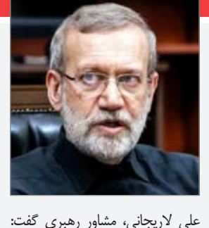
علی لاریجانی، مشاور رهبری گفت:

شما با تجربه ای که برای منصرف کردن ایران دارید و دیدید که نمی شود، پس دو راه بیشتر پیش رویتان دارید: یکی برگردید به همان برجامی که تصویب شده - ایران همیشه به شما گفته بیاید برگردید اشتباه تان را حل کنید البته خسارت های ما را هم باید یک جوری تأمین کنید - یک راه دیگر هم این است که خیلی خب، قبول ندارید؟ چون شنیدیم دولت جدید ایالات متحده گفته «ها آن برجام را اصلاً قبول نداریم چون ایرانی ها سر ما را کلاه گذاشتند» - آن وحی منزل نیست، بیاید سر موضوع جدید، شما می گوید «ایران هسته ای را ما قبول داریم، به سمت بمب نرود عیب ندارد!» ما غنی سازی در این حد داریم،