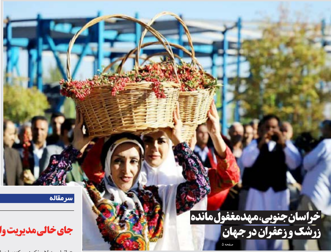
خراسان جنوبی، مهد مغفول مانده زرشک و زعفران در جهان