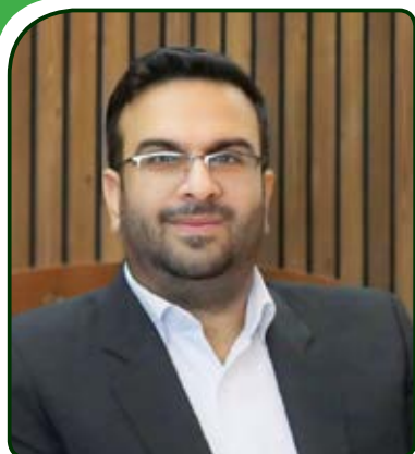
همشهریان عزیز می‌توانند با کمک از طریق شماره کارت ۶۰۴۳۳۷۰۰۴۸۱۵۷۵۷ یا از

کاروری دانشجویان دانشگاه همکاری جهت گذراندن دوره فرصت‌های مطالعاتی، تعیین و ارائه اولویت‌های تحقیقاتی و نیازمندی‌های علمی فناوریانه، فراهم آوردن امکان بازدید علمی اساتید و دانشجویان از موسسه از تعهدات موسسه خیریه توانبخشی حضرت علی اکبر (ع) خواهد بود. معاون علوم پزشکی دانشگاه آزاد اسلامی همچنین پاسخگویی به نیازمندی‌های علمی فناوریانه، برگزاری کارگاه‌ها و دوره‌های آموزشی مورد نیاز، انجام خدمات آزمایشگاهی و سنجش جامعه هدف، استفاده از فضای رفاهی و ورزشی و تفریحی برای استفاده پرسنل و توتخواهان موسسه و برگزاری برنامه‌های فرهنگی متناسب با ایام سال نیز از جمله تعهدات دانشگاه آزاد