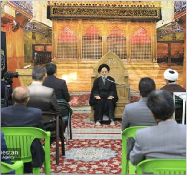
رئیس ستاد بازسازی عتبات خراسان