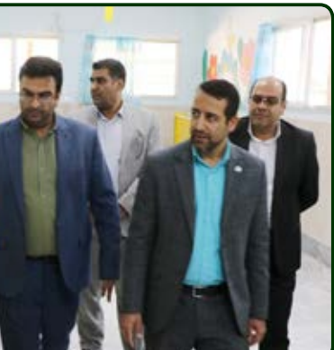
تکمیلی و اجرای طرح‌های تحقیقاتی جهت انجام اولویت‌های تحقیقاتی مورد نیاز موسسه است. وی افزود: همکاری دانشگاه در تامین نیازهای امور کتابخانه‌ای شامل ساماندهی کتابخانه و فناوری اطلاعات، برگزاری دوره‌های توانمندسازی و روانشناختی افراد تحت پوشش و همچنین