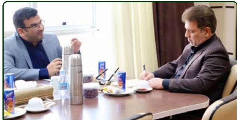
وی ادامه داد: اکنون بیش از ۴۰۰ توتخواه در چهار بخش کارگاه‌های حرفه‌آموزی، شبانه روزی دختران، پسران و سالمندان به همت ۱۵۰ پرسنل زحمتکش نگهداری و مراقبت می‌شوند و اکنون این مرکز بعد از ۲۷ سال به عنوان بزرگترین آسایشگاه نگهداری معلولان