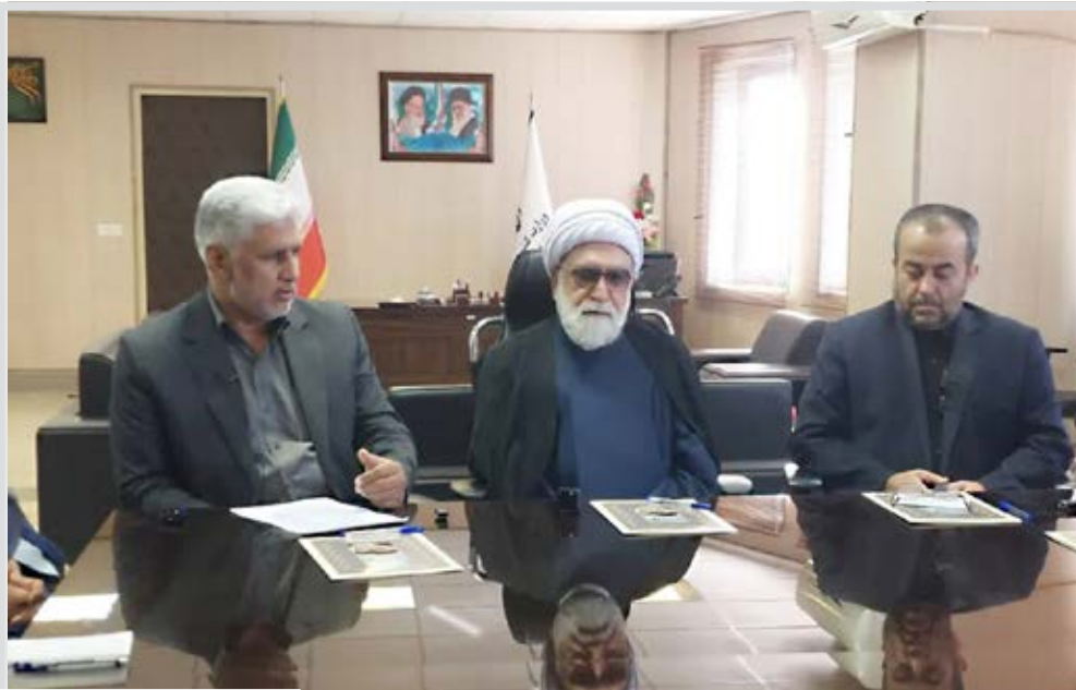
ابلاغ تسلیت رهبری به داغداران طبس

رئیس اداره داروهای طبیعی، سنتی، مکمل و شیر خشک معاونت غذا و دارو دانشگاه علوم پزشکی بیرجند از پیگیری ها برای تامین شیر خشک در خراسان جنوبی خبر داد. هنرمند با اشاره به اینکه شیر خشک برند نان در داروخانه ها به وفور وجود دارد، گفت: شیر خشک برندهای آیتامیل و بلباک در داروخانه ها با کمبود مواجه است. وی نیاز داروخانه ها را ماهانه حداقل ۵ هزار عدد از هر کدام از این شیر خشک ها دانست و گفت: از شیر آیتامیل ۱ دو هزار، آیتامیل ۲ چهار هزار و آیتامیل ۳ حدود ۷ هزار براساس الگوی مصرف ابلغی سازمان غذا و دارو باید توسط شرکت های توزیع کننده در استان توزیع شود. هنرمند، علت کمبودها را کاهش مقطعی تولید برخی برندهای شیر خشک در کارخانجات تولیدی به دلیل تامین مواد اولیه از خارج کشور دانست. وی این کمبود را موقتی عنوان کرد و گفت: مردم به حد نیاز شیر خشک تامین کنند و تاکید بر تهیه شیر خشک از برند خاصی نداشته باشند چرا که فرمولاسیون شیر خشک ها یکی است. وی افزود: مردم می توانند در صورت نیاز از سایر برندهای شیر به عنوان جایگزین استفاده کنند.