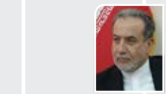
عراقچی، وزیر امور خارجه: