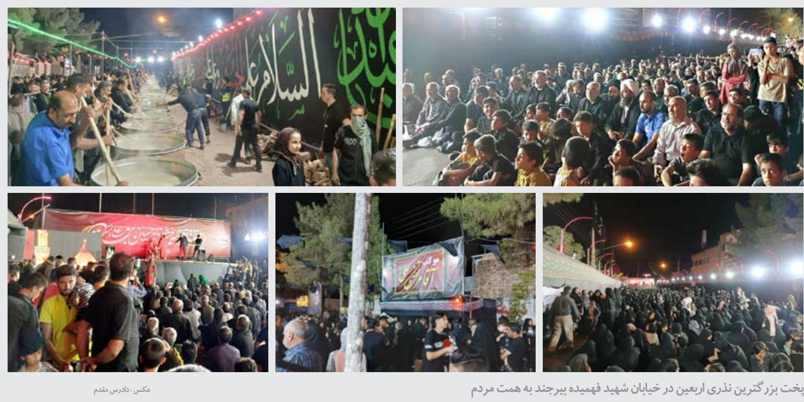
یخت بزرگترین نذری اربعین در خیابان شهید فهمیده بیرجند به همت مردم

بازار سکه و طلا روز نسبتاً آرامی را پشت سر گذاشت. سکه امامی ۴۲ میلیون و ۵۲۵ هزار تومان ارزش گذاری شد. همچنین دلار به قیمت ۵۸ هزار و ۱۰ تومان به ثبت رسید.