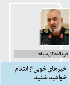
فرمانده کل سپاه: