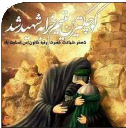
شهر شهادت حضرت رقیه خاتون اس مصلحت با