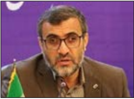
معاون هماهنگی امور عمرانی استانداری

ستاد اجرایی خدمات سفر استان با اشاره به تقارن ماه مبارک رمضان و عید نوروز اظهار کرد:استان در مسیر عبور مسافران زیارتی مشهد مقدس قرار دارد که در این شرایط باید توجه و نظارت ویژه ای به نمازخانه ها و مجتمع های بین راهی داشته‌باشیم.وی‌از کمیته‌های تخصصی خوست برنامه‌های‌اساسی‌راتوین‌کرده و در جلسه بعدی ستاد خدمات سفر ارائه کنند معاون استاندار بر لزوم ارائه نیازها،