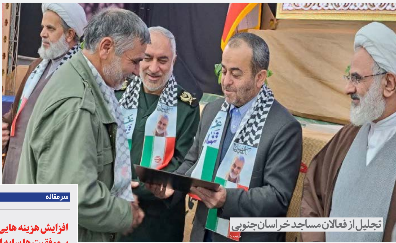
تجلیل از فعالان مساجد خراسان جنوبی

با وجود تحریم هادر خراسان جنوبی محقق شد؛