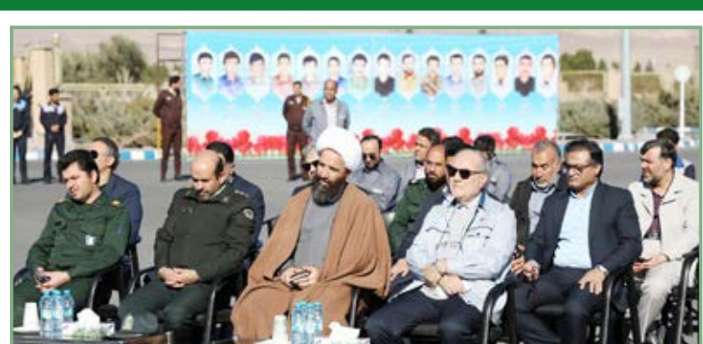
برکات زیادی به یمن میزبانی و خادمی شهید گمنام، نصب کویر تایر گردید