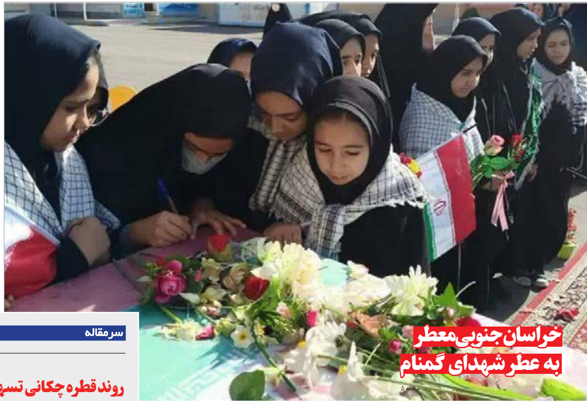
خراسان جنوبی معطر به عطر شهدای گمنام