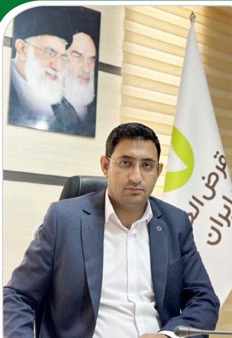
درمان، تحصیل و همچنین بازسازی و توسعه روستاها و مناطق محروم و ... تخصیص دهد.