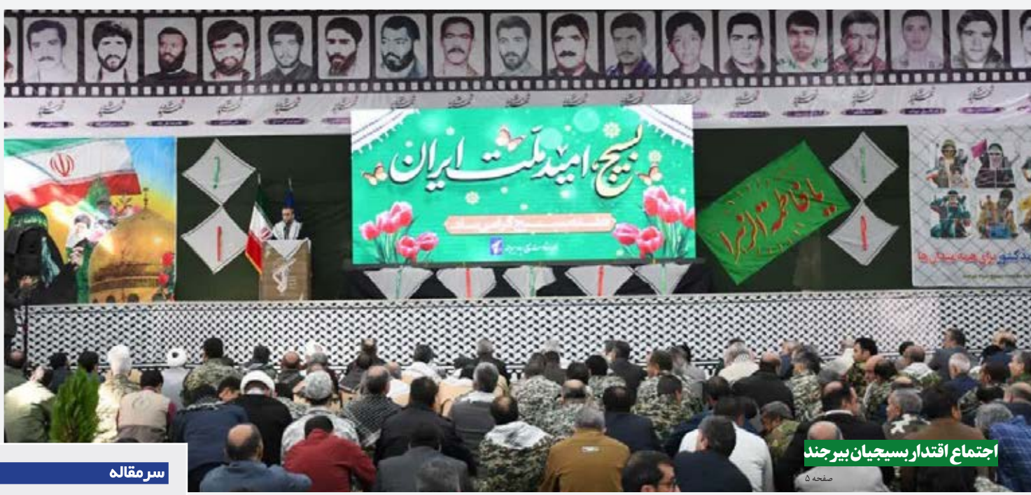
اجتماع اقتدار بسیجیان بیرجند