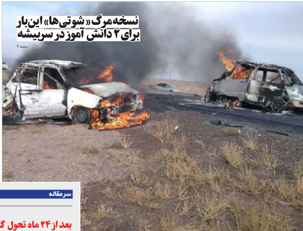
نسخه مرگ (شوتی ها) این بار برای ۲ دانش آموز در سرپیشه

سید علیرضا موسوی نژاد - مدیر کل آموزش و پرورش خراسان جنوبی